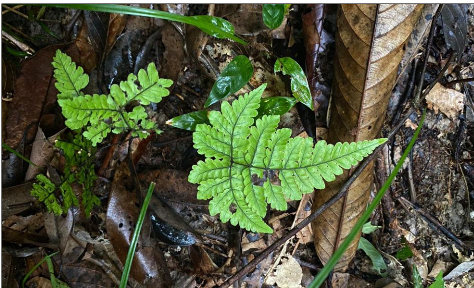
FIGURA 1: Cruzos de vidas

Inundadas pela umidade da mata, sentadas em pedaços de troncos... terra úmida. Som que conclama vidas. Vidas encantadas por sons, cheiros e toques, vidas que sobressaem a relação humana; está para além; está para a vida na imanência de corpos que se cruzam e se entrelaçam entre troncos, folhas, terra, formigas, espinhos, sons de passarinhos e tantos outros mais que humanos que os olhos não conseguem acompanhar. Na batida dos troncos, chama-se a vida; no estalar de galhos e folhas, sussurram-se segredos. Feixes de luz adentram os mistérios da floresta. Da terra, nasce a vitalidade da (de)composição (Figura 1).