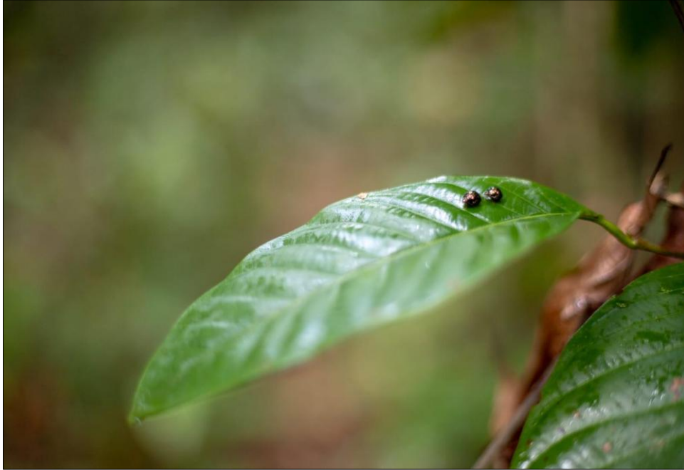
FIGURA 3: ensinanças-folhas