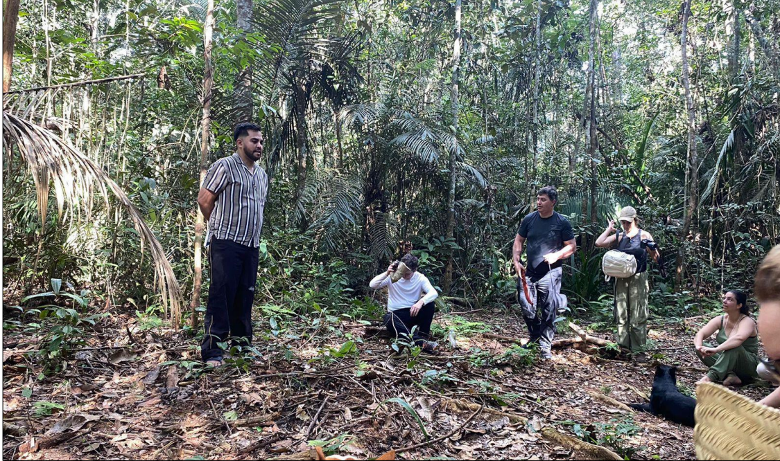
FIGURA 2: Em-corpar em floresteiros sonoros