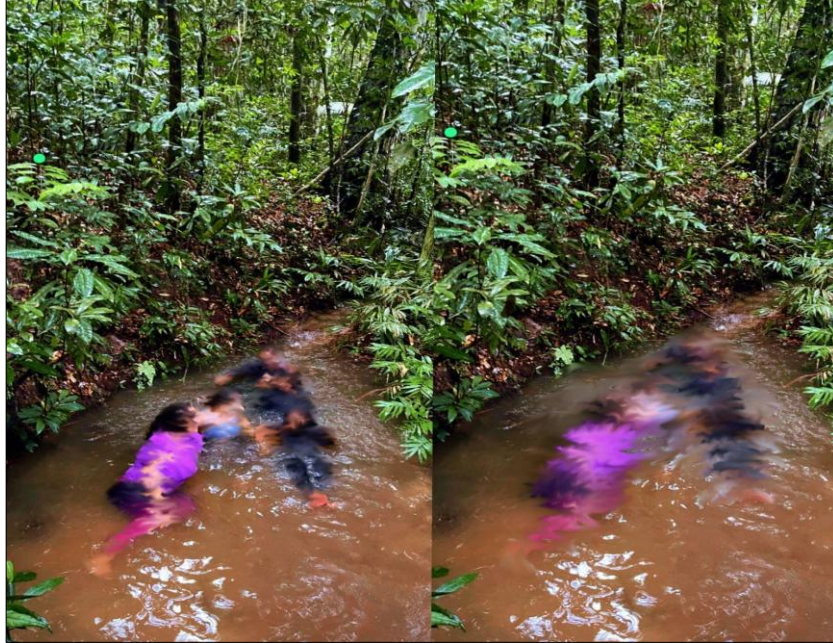
FIGURA 4: Corpos-docências enquanto nascenças-rios

e rompe o solo de modo a iniciar um Nós-Rio. Aqui, os corpos-docência-floresta-semente se abrem e nascem enquanto nascenças-rios (Figura 4).