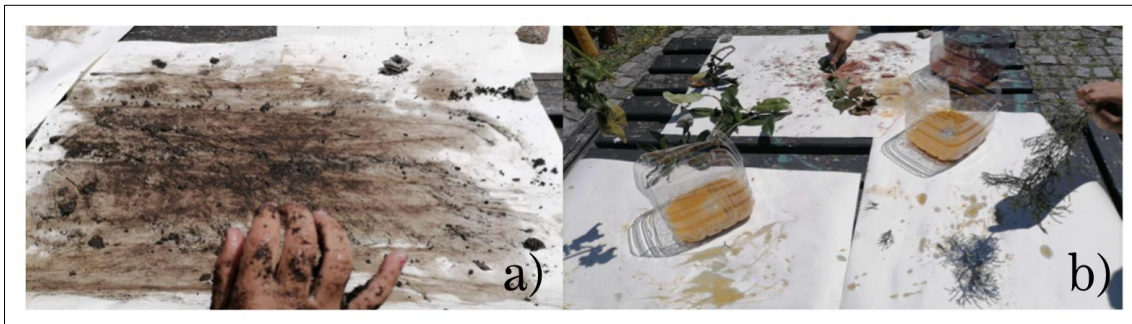
FIGURA 2: a) Pintura com lama; b) Pintura com pincéis naturais, 2024.