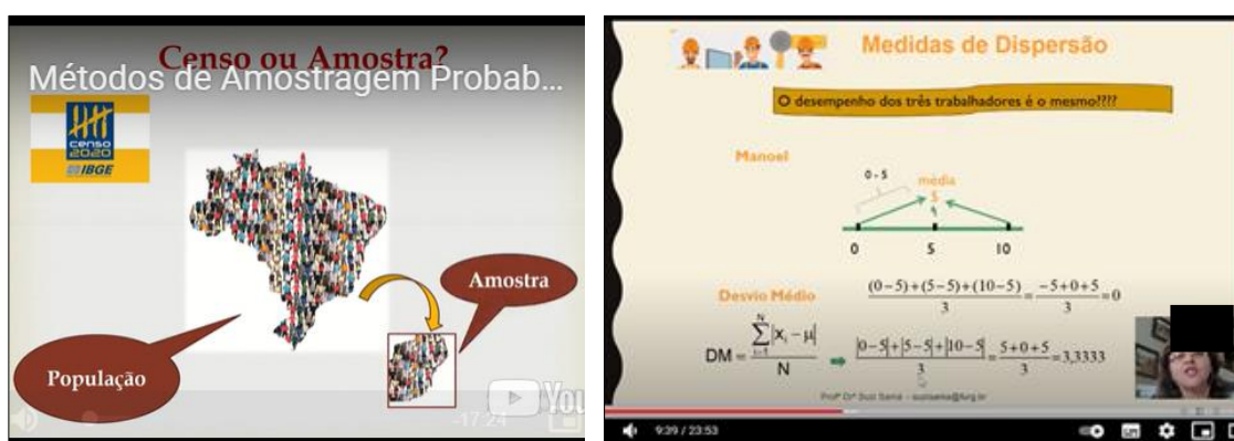
FIGURA 4: Lecciones en vídeo sobre los conceptos estadísticos trabajados en los proyectos