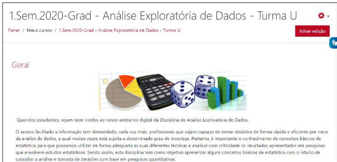
FIGURA 3: Entorno virtual de aprendizaje del curso EDA