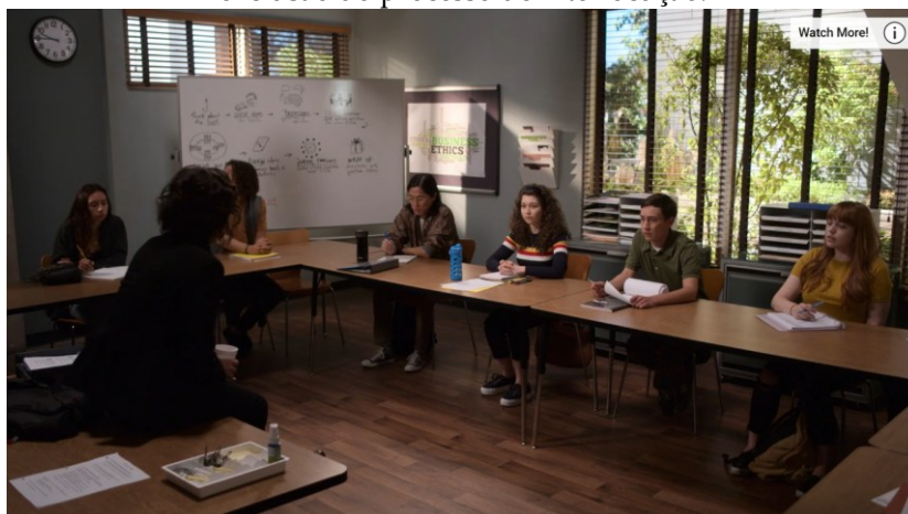
Figura 1 – A interrupção da relação dialógica no ambiente acadêmico. O frame captura a falha na instauração da correlação de pessoa ( eu-tu ), evidenciando como a desconsideração das especificidades comunicativas do sujeito com TEA pode resultar em uma ruptura na dinâmica enunciativa e na sua exclusão do processo de interlocução.