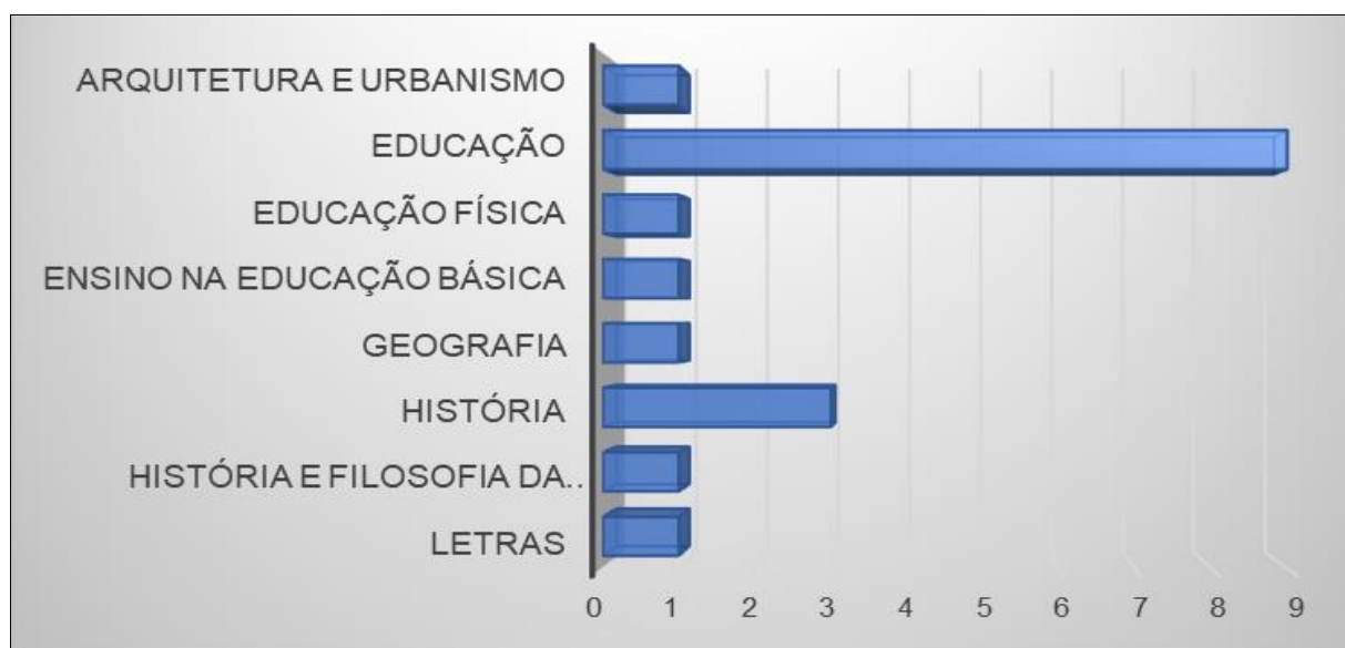
Gráfico 1 – Programas de Pós-Graduação aos quais se vinculam as produções