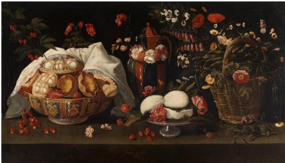
Figura 2 - Natureza-Morta com Doces e Flores, óleo sobre tela, 85 x 160,5 cm, Biblioteca Municipal Anselmo Braamcamp Freire Santarém, Josefa de Óbidos, 1676.

Fonte: SERRÃO, V. Josefa de Óbidos e o tempo Barroco. Lisboa, 1991, TLP - Instituto Português do Património Cultural, p. 205.