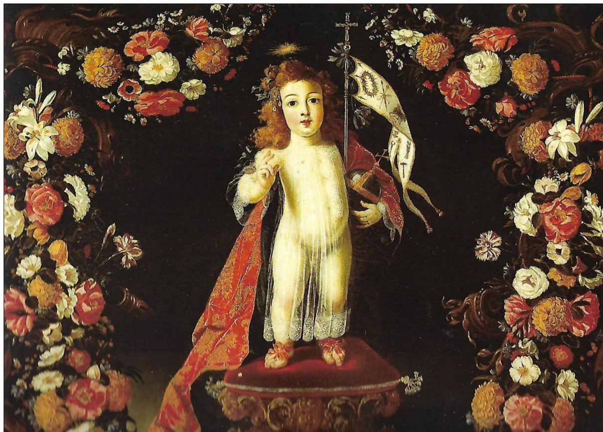
Figura 1 - O menino Jesus Salvador do Mundo, óleo sobre tela, 95 x 116,5 cm, Igreja Matriz de Cascais, Josefa de Óbidos, 1673.