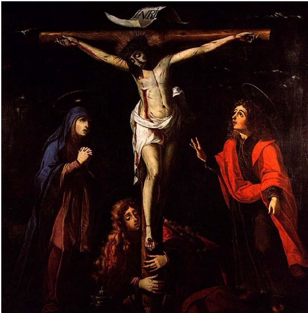
Figura 4 - Calvário, óleo sobre tela, 160x174 cm, Santa Casa da Misericórdia de Peniche, Josefa de Óbidos, 1984.

Fonte: SERRÃO, V. Josefa de Óbidos e o tempo Barroco. Lisboa, 1991, TLP - Instituto Português do Património Cultural, p. 222.