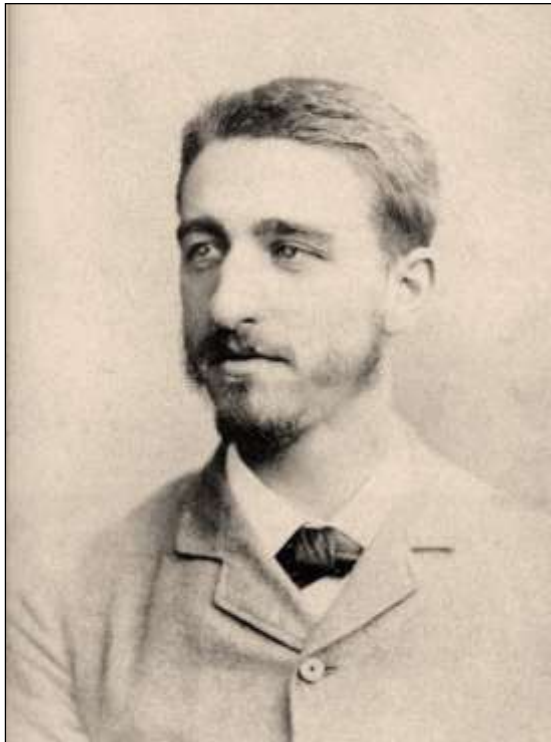
Figura 2: Manuel Bartolomé Cossío en Londres, agosto de 1884.