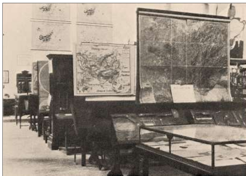
Figura 3: Sala del Museo Pedagógico Nacional. Madrid, 1909.