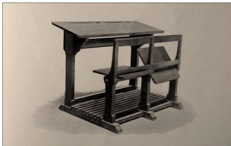
Figura 4: Modelo de mesa-banco escolar bipersonal diseñado por el Museo Pedagógico.