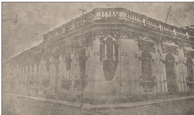
Figura 3 – Edifício da Escola Normal