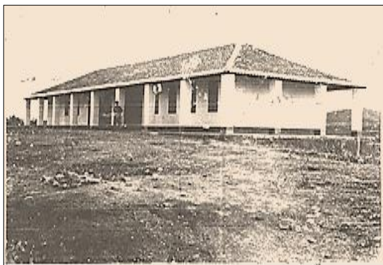
Figura 1 – O Grupo Escolar Elizeu Campos em 1960