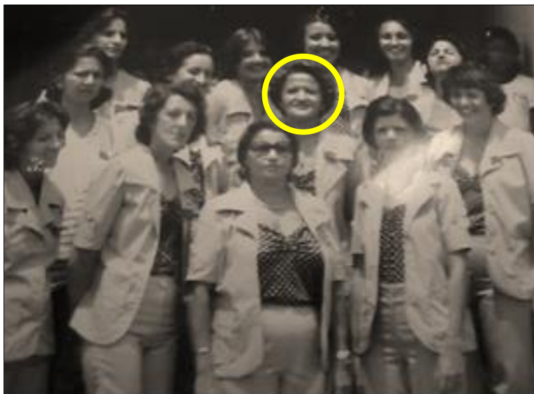
Figura 2 – Professoras de Mirandiba na década de 1970.

da manifestação humana, que o sujeito símbolo se traduz na dialética do tópico e utópico (REZENDE, 1990).