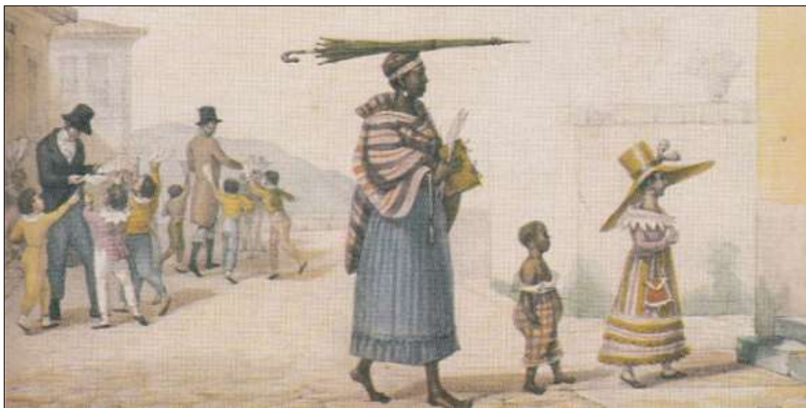
Figura 1- Concurso de composição entre escolares no dia de Santo Alexis (17 de julho).

Fonte: Debret, J.B. 1839. (apud LOPES, 2012, p.74).