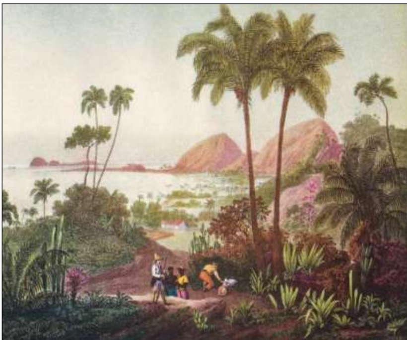
Figura 2. Praia Rodrigues perto do Rio de Janeiro (1827)