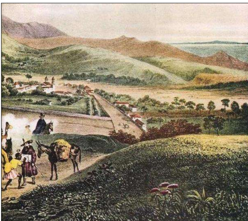
Figura 3. Matosinho perto de São João Del Rey (1835).