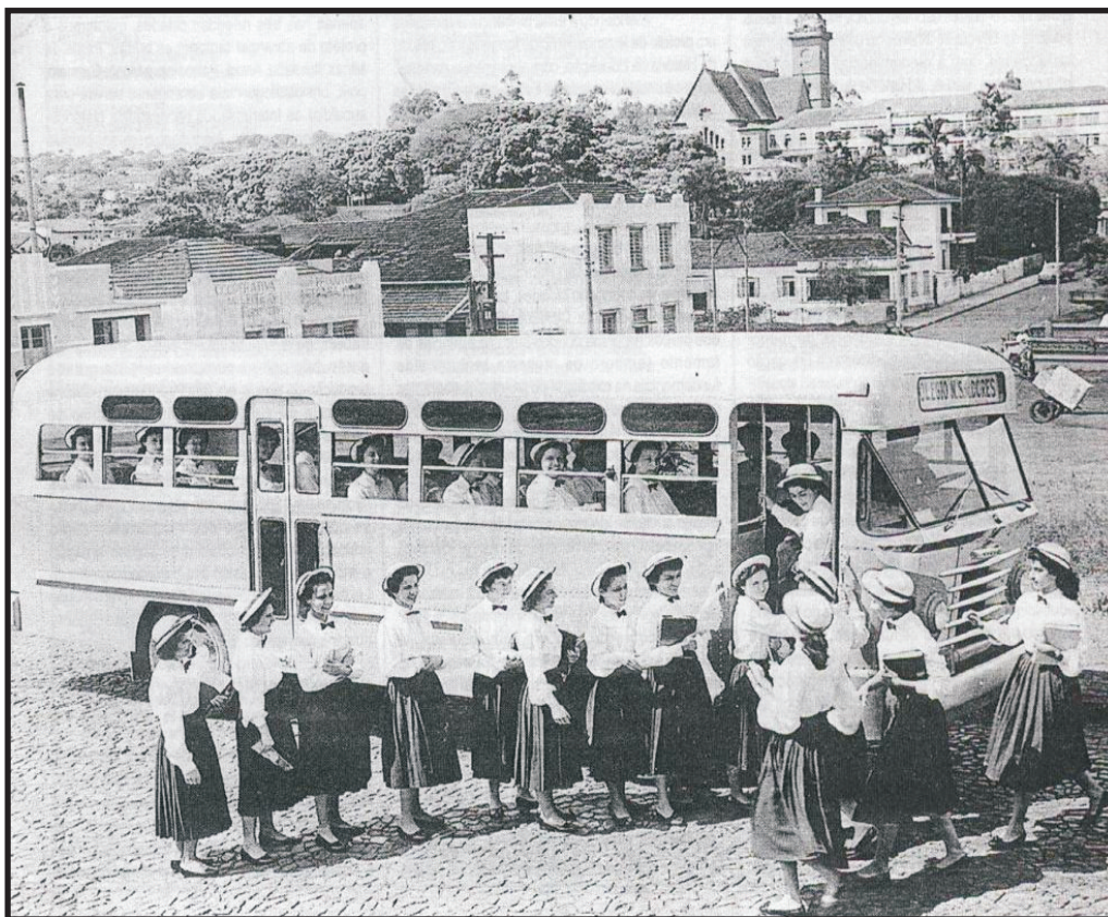
Figura 2 -Alunas do Colégio em Excursão, em 1952.

Apesar da utilização de vários recursos didáticos citados nos relatos, como mapas, painéis, visita aos laboratórios, excursões (figura 2, abaixo) as práticas pedagógicas centravam-se na figura do (a) professor (a), delimitando, assim, os contornos de uma pedagogia tradicional, com ênfase na memorização dos conteúdos, o que era predominante naqueles tempos.