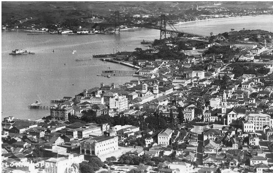
Fotografia 1 - Florianópolis na década de 1930; ao fundo a área continental ainda rural