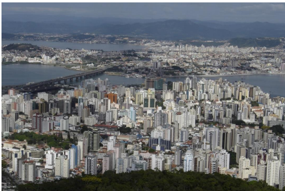
Fotografia 8 - Florianópolis na atualidade; ao fundo a área continental também urbanizada