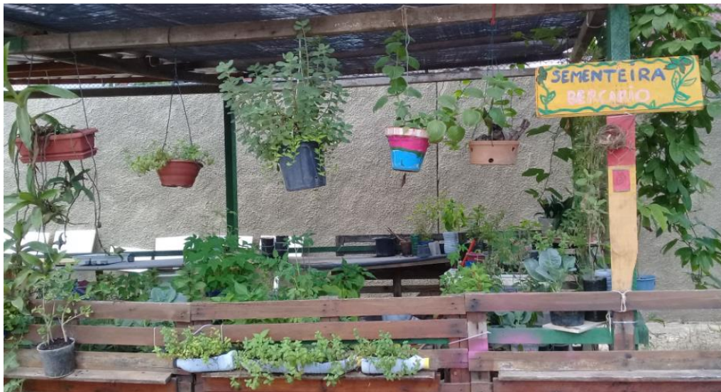
Fotografia 4 – Sementeira coletiva do Jardim Secreto

Da mesma forma como não havia regras para a produção, também não havia para o consumo dos alimentos. Havia e ainda há, uma certa dificuldade em se estabelecer a lógica de distribuição de consumo, uma vez que a área é aberta e de acesso público irrestrito. Durante as rodas de conversas, foram relatados que em algumas ocasiões as hortas foram parcialmente destruídas por vandalismo ou que os produtos foram levados, quase a totalidade, por visitantes que não participaram do processo coletivo de cultivo. A sementeira, na fotografia 4, foi alvo de ações de vandalismo.