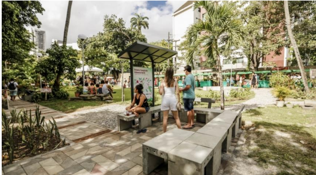
Fotografia 2 – Jardim Secreto após o transplante da praça da Casa Cor