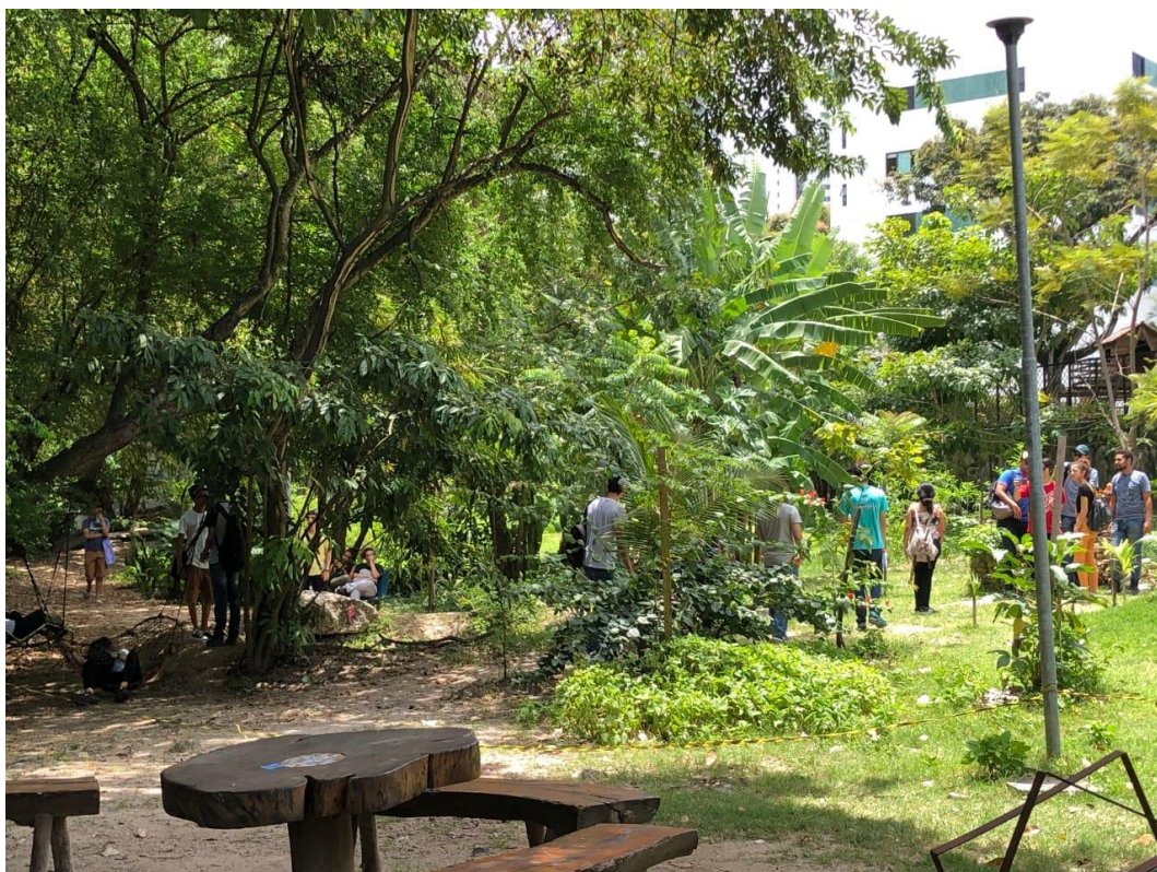
Dezembro / 2023.

A contínua mobilização da comunidade, hoje identificada como os membros do coletivo Jardim Secreto, entorno da criação e manutenção da horta comunitária, fez esse grupo perceber que a mobilização social articulada e permanente permitiria uma ampliação das possibilidades dos usos, formas e funções da área. Assim, em processo dinâmico, os envolvidos foram criando articulações, agregando e se agregando com as Universidades, outros coletivos de produção de agricultura urbana, possibilitando um novo movimento que envolvia não só os moradores do entorno imediato, mas toda a cidade.