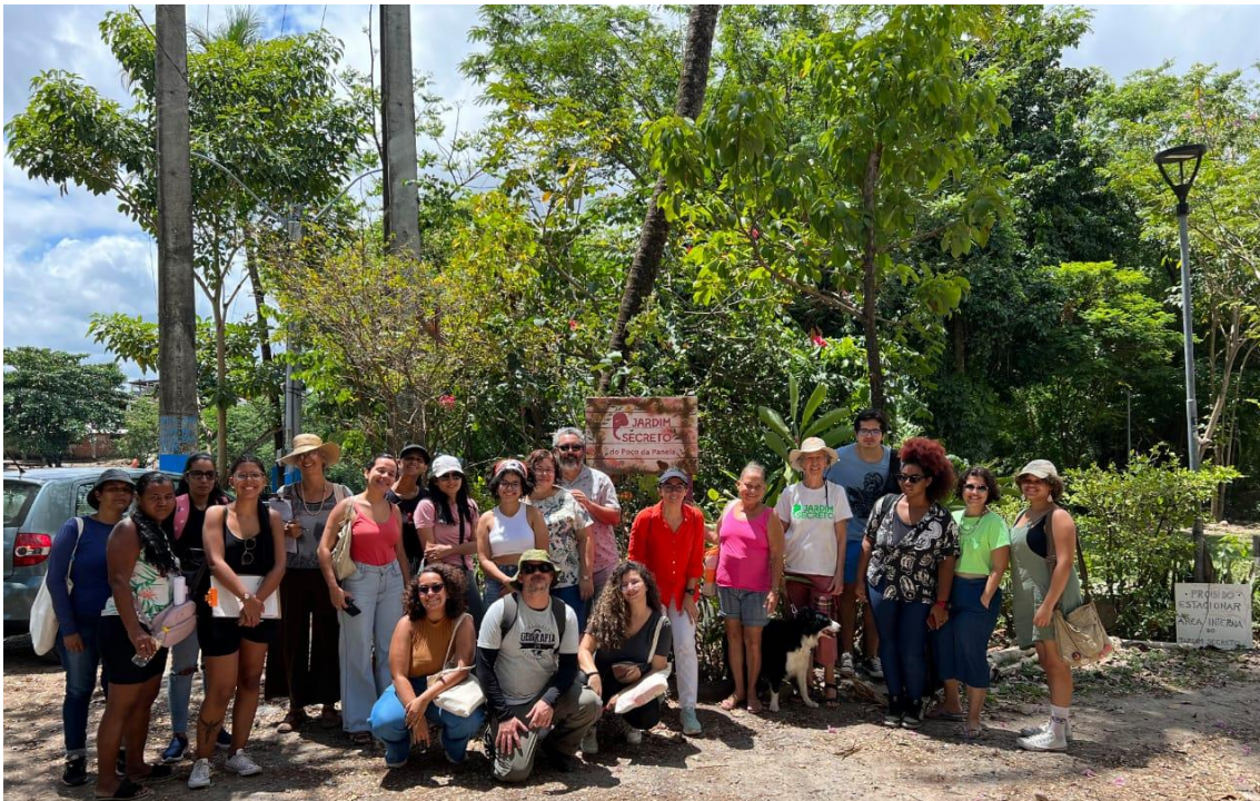
Fotografia 1 – Trabalho de campo com alunos de graduação no Jardim Secreto