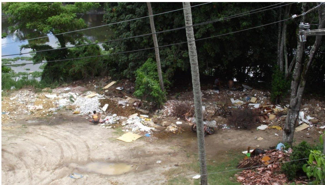
Fotografia 3 – Local onde atualmente é o Jardim Secreto após a passagem dos tratores

Outubro/2015.