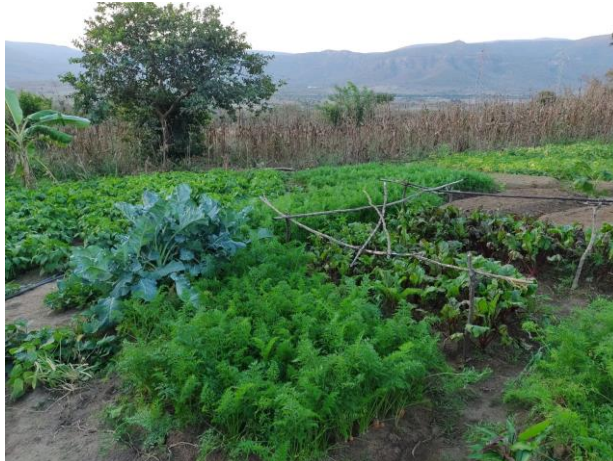
Fotografia 1 - Horta na propriedade de um assentado

A produção agrícola desenvolvida no assentamento é de um trabalho coletivo familiar (Fotografia 1), todos têm uma função na prática: desde a produção, manejo, colheita até a venda. A comercialização dos excedentes ocorre na feira livre, porém alguns participam do Programa de Aquisição de Alimentos (PAA) e do Programa Nacional de Alimentação Escolar (PNAE), o que permite que entreguem esses produtos para as escolas do município. Aqueles agricultores que não conseguem uma produção em maior escala, às vezes, comercializam na própria comunidade e utilizam o restante da produção para consumo próprio. Sendo assim, o PAA e o PNAE são canais relevantes para escoamento da produção e fortalecimento da renda. Entretanto, desafios logísticos, instabilidade na continuidade dos programas e limitações na organização produtiva ainda dificultam maior inserção nos mercados institucionais. Como ressaltam Anjos e Becker (2014), não basta produzir, é necessário garantir canais efetivos de comercialização.