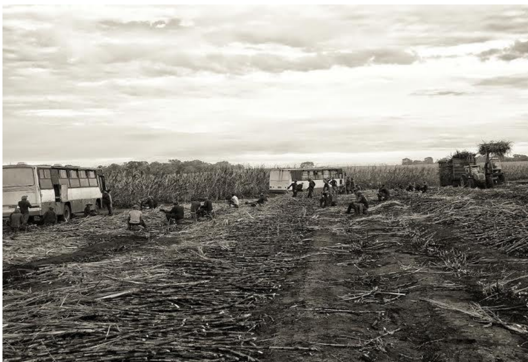
Foto 1: Trabalhador na Usina Laginha Agroindustrial S/A- Unidade Trialcool

Ao refletir sobre o assunto, ainda próximo do ônibus, observávamos os eitos sendo distribuídos, mas não ouvíamos nenhum tipo de manifestação contrária, tudo era silêncio. Na foto (1), podemos observar os trabalhadores sentados no entorno do ônibus arrumando as ferramentas de trabalho para colheita do dia.