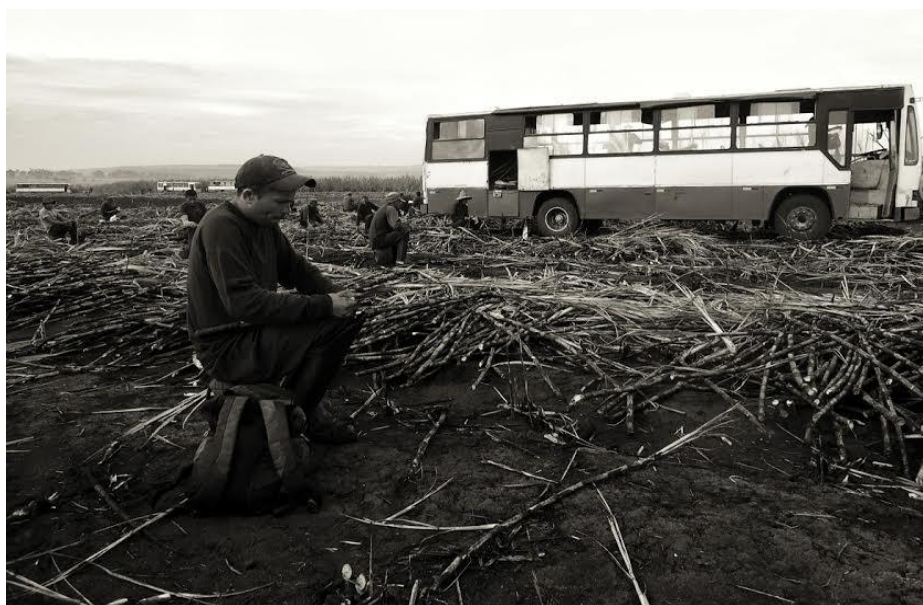
Foto 4: Trabalhador no final da jornada de trabalho na Usina Laginha Agroindustrial S/A- Unidade. Trialcool.

Ao final do dia, estavam todos em torno do ônibus esperando para ir para o alojamento organizando o material para o dia seguinte e preparando o jantar. Na foto (4) a seguir, podemos ver os trabalhadores à espera do chamado dos fiscais.