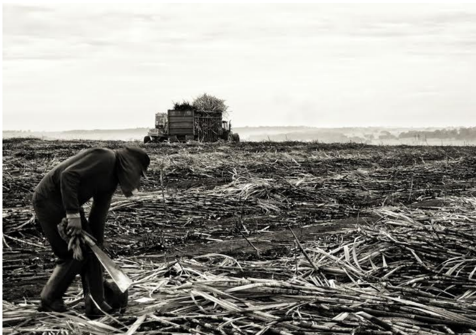
Foto 3: Trabalhador cortando cana na Usina Laginha Agroindustrial S/A- Unidade Trialcool