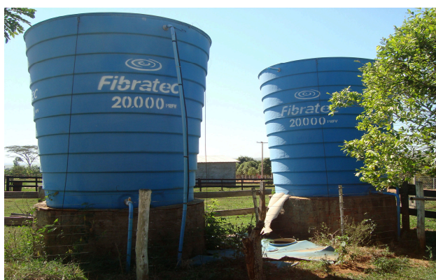
Figura 3 – Abastecedouros comunitários (20.000) no Programa Banco da Terra – Município de Santo Expedito/SP (2010)

Nos oito municípios estudados, em seis foram implantados abastecedouros comunitários, em 17 projetos de microbacias (EDR/CATI, Presidente Prudente, 2010). Estas instalações resultaram da parceria entre EDR/CATI, Prefeituras Municipais e empresas contratadas (Figuras 3 e 4).