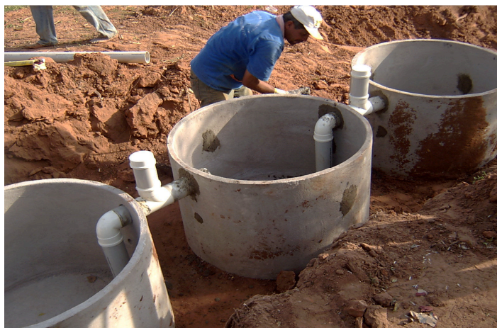
Figura 2 – Construção de fossa séptica biodigestora em propriedade rural no Município de Santo Expedito/SP (2008)