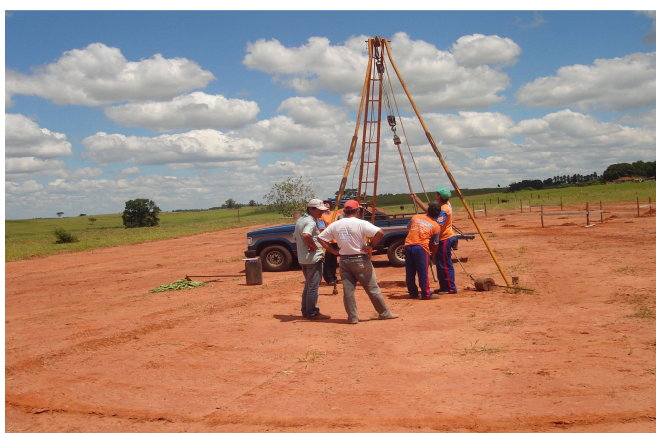
Figura 4 – Trabalhos de perfuração de poço para instalação de abastecedouro comunitário no Município de Santo Expedito/SP (2008)