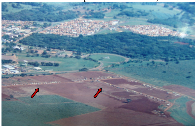
Foto 5 - Espaço provisório onde os assentados ficaram

Durante o período em que ficaram no espaço provisório de 160 alqueires, houve entre os assentados e os funcionários do INCRA várias reuniões para a tomada de decisão sobre quantas famílias iriam ser realmente assentadas. Naquele momento, a intenção do INCRA, segundo os assentados, era de fazer uma “peneira” e assentar somente 163 famílias. Após várias outras reuniões e da formulação de um abaixo-assinado pelas 218 famílias, onde exigiam do INCRA que assentassem todas as famílias, houve novas propostas do INCRA para assentar mais famílias. Desta maneira, acabaram entrando em acordo devido a desistência de algumas famílias, e assentaram todas as que continuavam na luta.