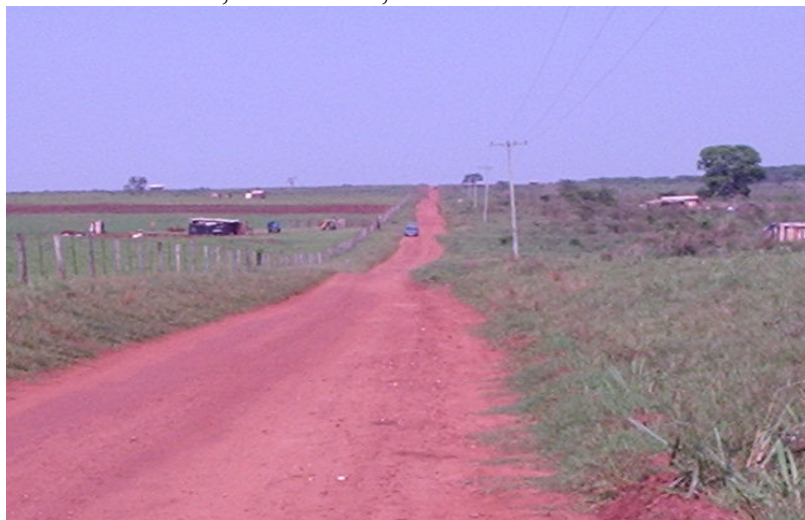
Foto 6 - Estrada de acesso aos lotes: início da organização

Durante esse período de espera pela demarcação exata de suas terras e das verbas para estruturação dos lotes, eles plantaram alguns legumes e verduras e também criaram animais para consumo nos lotes. Contudo, como ainda não estava oficializada a separação dos lotes, os assentados não ampliaram suas plantações, pois muitos temiam que durante o processo de divisão definitiva dos lotes tivessem que sair de onde estavam e, assim, acabariam perdendo o que plantaram. Segundos relatos de assentados, alguns realmente optaram por mudar de área, devido a localização ou a qualidade da terra.