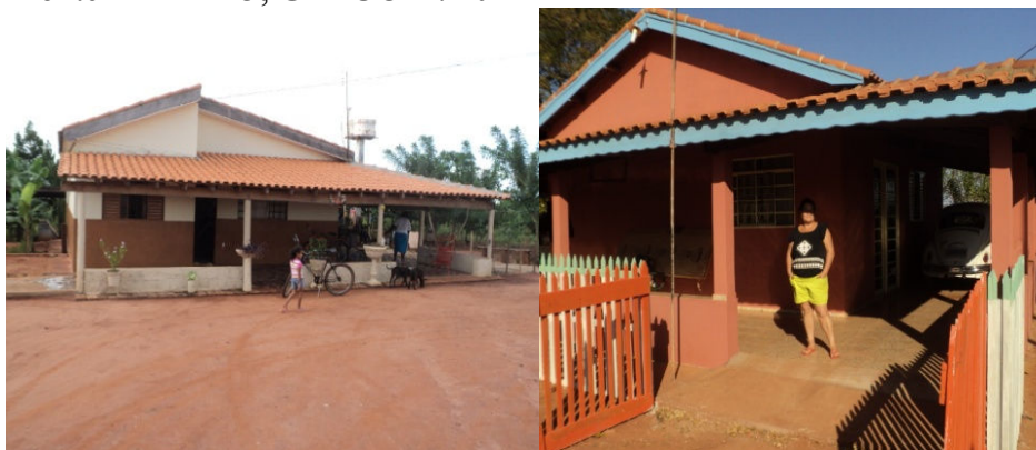
Foto 8 - Diferenças nas estruturas das casas

Como evidência dessa heterogeneidade basta observar a diferença de estrutura entre algumas casas nos lotes, onde algumas possuem uma estrutura muito favorável; outras foram construídas com o básico disponibilizado pelo INCRA, outras se quer foram estruturadas.