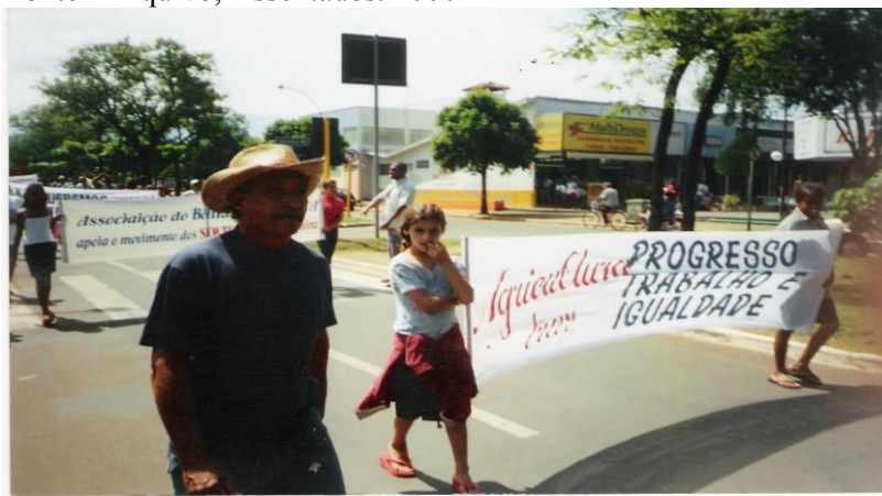
Foto 4 - Passeata dos acampados pela cidade

Com a caminhada, a proposta principal era chamar a atenção dos munícipes para a importância da implantação do assentamento, onde a partir dali, geraria maior desenvolvimento à agricultura e para a economia da cidade de Ilha Solteira.