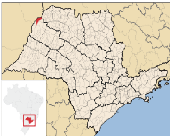
Mapa 1-Ilha Solteira no Estado de São Paulo.