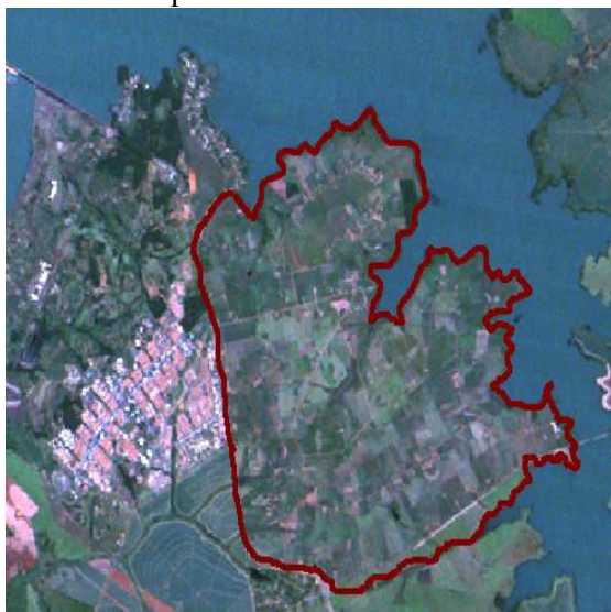
Foto 7-Localização do Assentamento