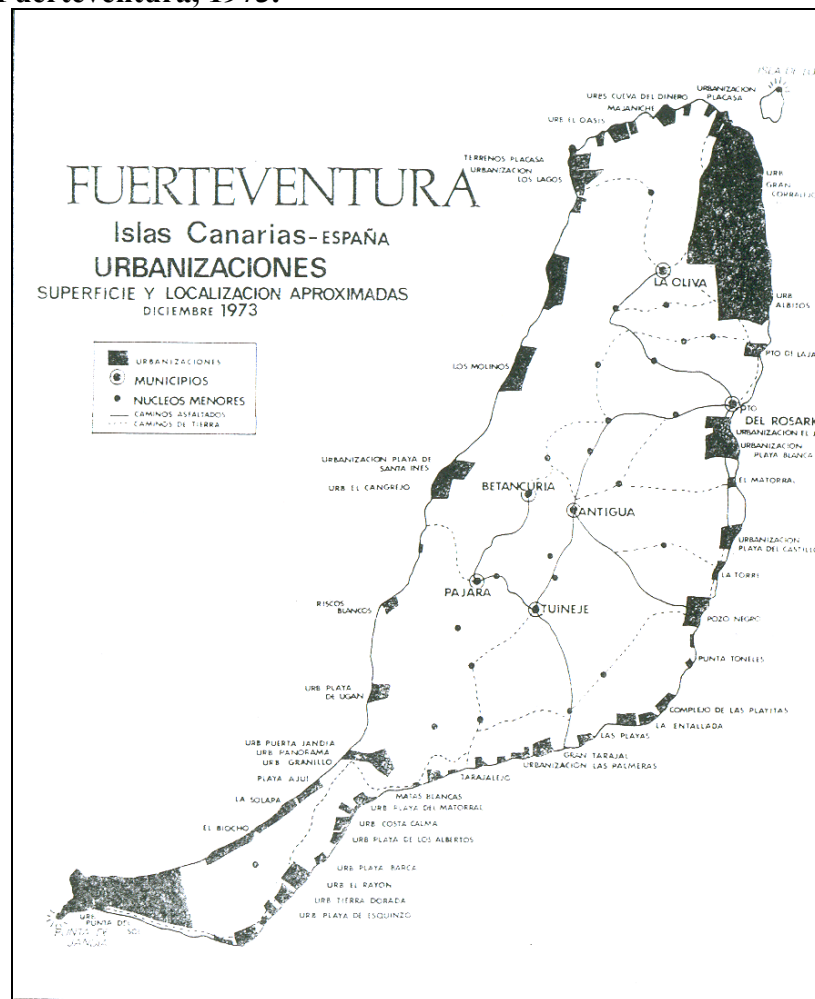
Figura 2 - Localización de las urbanizaciones turísticas de la Isla de Fuerteventura, 1973.

Tercer Mundo (entre los que España estaba incluida) a cambio de beneficios fiscales y b) la aprobación local por la C.P.U. (Comisión Provincial de Urbanismo) de la Circular sobre Planes Especiales con Finalidad Turística (MARTÍN MARTÍN, 2000, p. 62). La mayoría de estos planes especiales quedaron paralizados como consecuencia de la crisis económica mundial de 1973, pero las tierras calificadas como urbanizables van a mantener sus expectativas turísticas en espera de nuevos capitales del exterior. Por ello no es extraño que cuando en 1987 el Parlamento de Canarias declare como parque natural la Península y Dehesa de Jandía lo haga sólo sobre 14.318 de las 17.827 has de la misma, quedando las restantes 3.500 has de suelo del sotavento de Jandía como urbano (los planes especiales aprobados en la década anterior), urbanizable y rústico con posibilidades de ser recalificado como urbanizable (Figura 2).