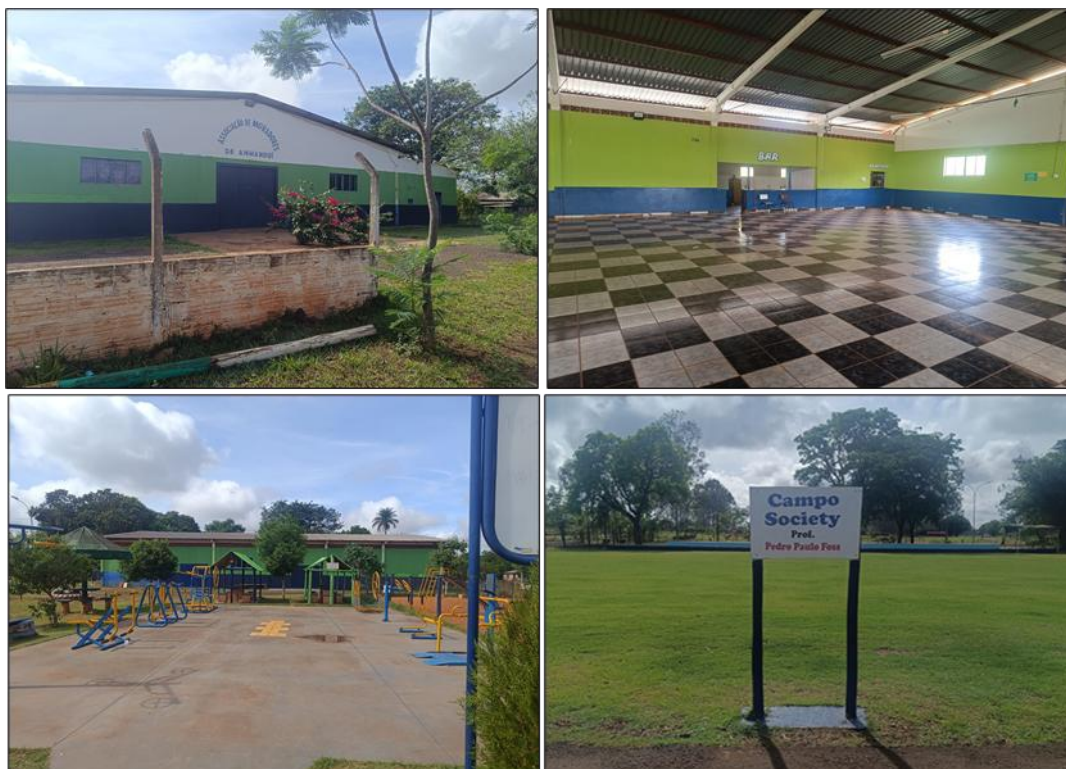
Figura 3 - Espaço comunitário da Associação de Moradores de Anhanduí, Campo Grande, Mato Grosso do Sul