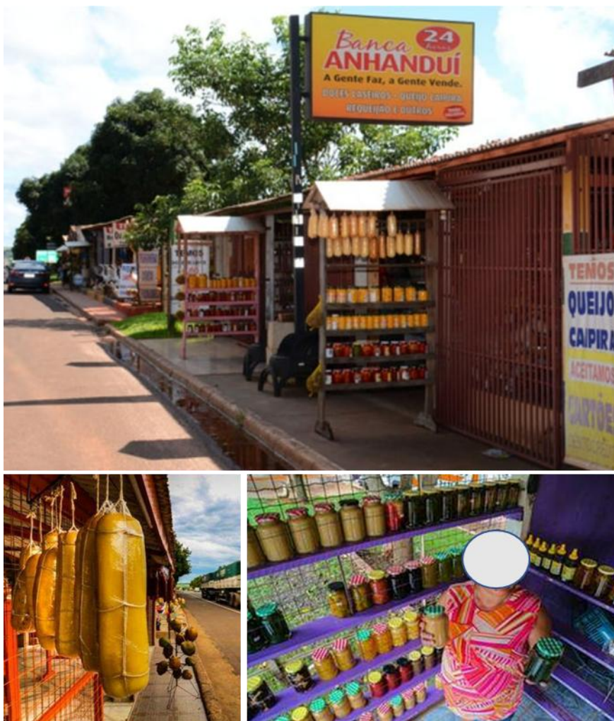
Figura 2 - Bancas à beira da rodovia BR-163, distrito de Anhanduí, Campo Grande, Mato Grosso do Sul