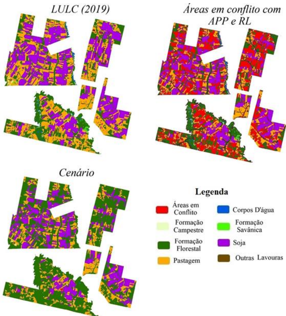
Figura 3 - Assentamentos Rurais: representação do uso e cobertura da terra e áreas em conflito em 2019, e o cenário de recuperação florestal.

perspectiva, ao readequar as áreas de pastagem e soja no cenário, indicando a restauração da floresta, a paisagem mudou consideravelmente a configuração dessa unidade (Figura 3).