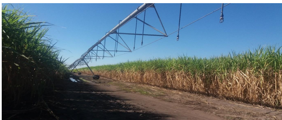
Figura 3: Cana irrigada por pivô central em solo drenado.