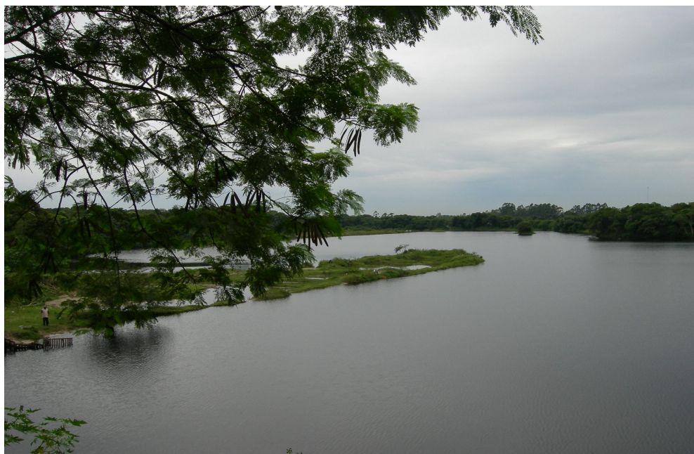
Foto 2 Cavas contiguas ao lixão