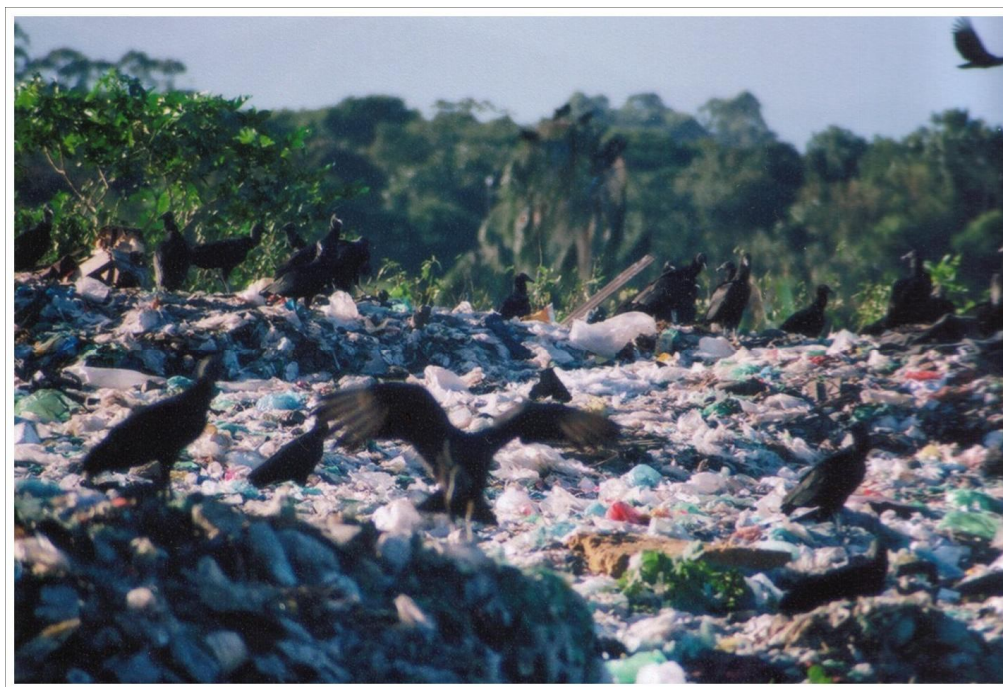
Foto1 Lixão de Paranaguá