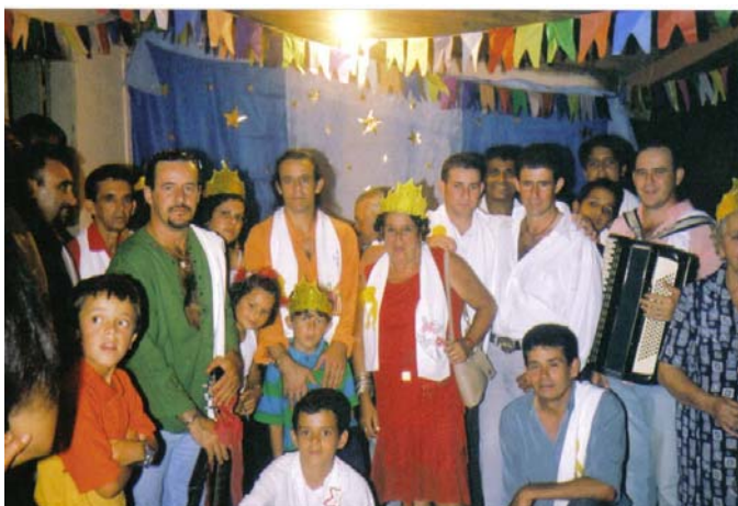
Figura 5 - Sacralidade da Festa de Reis da Fazenda Cocal com a participação das crianças rezando o terço

Autor: Admilson José dos Santos. Jan/2004