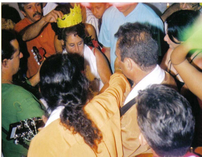
Figura 6 - A coroação dos festeiros novos na Festa da Fazenda Cocal

Jan/2004