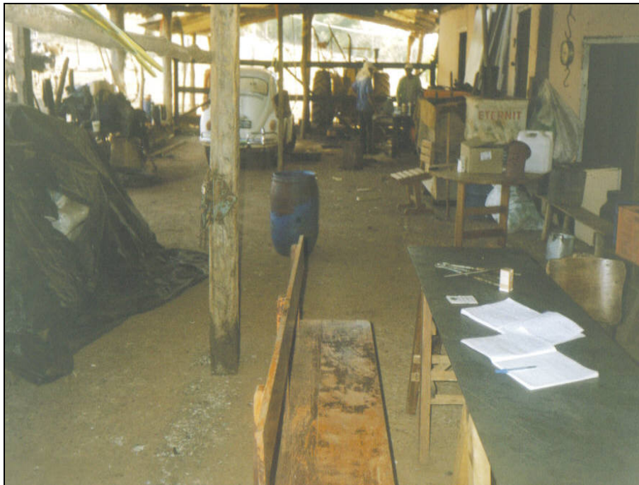
Figura 3 - Atividades Econômicas: representação do profano na Fazenda Cocal Janeiro 2004

realização do ritual da festa é um exemplo claro disso, pois é utilizado o ano todo de maneira profana, para guardar outras coisas que são a explicitação do modelo capitalista, como máquinas, produtos agrícolas, tratores, carros, etc.