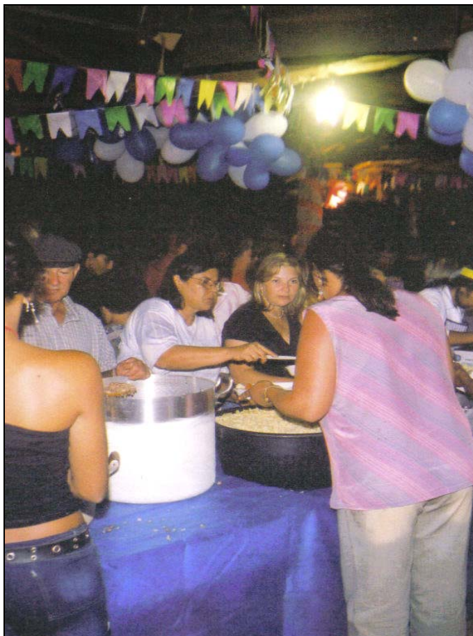
Figura 9 Barracão enfeitado com bandeirinhas: onde se serve a comida durante a festa Autor: Admilson José dos Santos Janeiro 2004

Essa festa mostra também como a fé e a devoção são fatores ainda determinantes para manter uma manifestação que é, ao mesmo tempo, a exteriorização da devoção, e uma tradição familiar, que se tornou ao longo do tempo um elo de ligação entre parentes e amigos que resistem e demonstram que essa tradição não pode acabar.