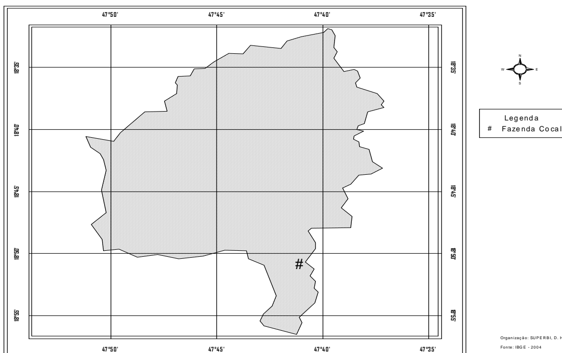
Figura 1 - Localização da Fazenda Cocal, Estrela do Sul (MG) Fonte: IBGE, 2004, Org: SUPERBI, D.H.A.

Por outro lado, quando a festa acaba e todos retomam sua rotina, o ambiente volta a se impregnar de práticas profanas, que passam a se manifestar diariamente através das relações econômicas e sociais estabelecidas nesse ambiente que, antes, era absolutamente sagrado.