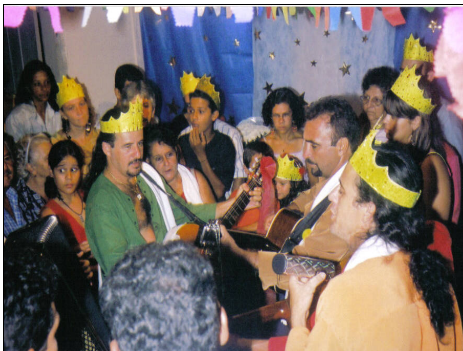
Figura 8 - Apresentação da Folia no momento da festa cantando versos como “os três reis saíram andando assim meio sem destino/saíram andando para visitar Jesus menino”

Nesse sentido, a festa pode significar também o fato de que a família tem historicamente uma ligação muito forte com o sagrado. Portanto, o sagrado se estabelece de forma clara na festa da fazenda Cocal e promove a manifestação da família que se mobiliza inteiramente, fazendo todos os esforços necessários para realizá-la e para mantê-la na família. A festa de Santos Reis da fazenda Cocal, na região de Mutum, mostra-nos que ainda hoje são possíveis manifestações culturais que são muitas vezes confundidas como folclore, já que são cada vez mais raras. Mostra-nos ainda que, mesmo diante da modernidade, são possíveis processos de resistências que se dão através de manifestações religiosas e culturais populares.