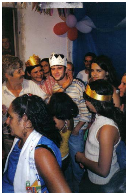
Figura 7 - A família se despedindo dos visitantes no barracão da festa

Autor: Admilson José dos Santos. Jan/2004