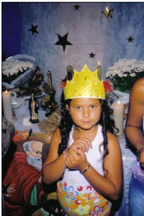
Figura 4 - A Folia de Reis no Ritual da entrega da coroa, Fazenda Cocal

Autor: Admilson José dos Santos. Jan/2004