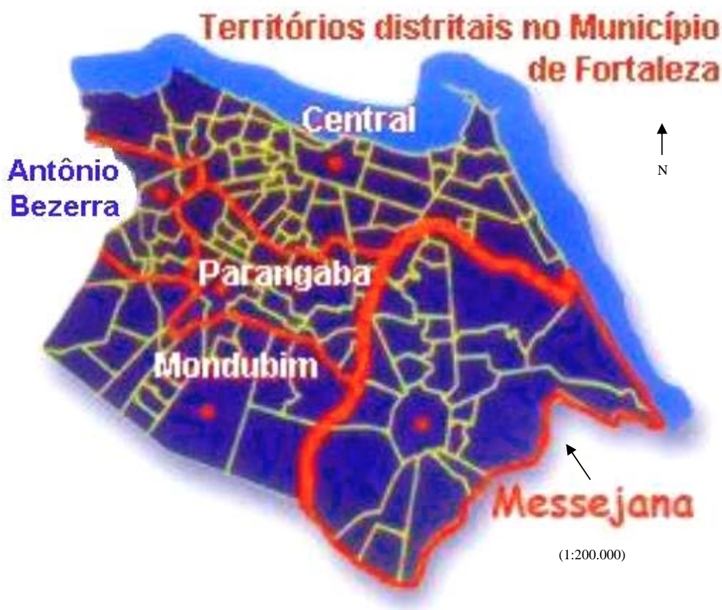
Figura 2 - Destaque do Distrito de Messejana no Município de Fortaleza

configuração territorial intra-urbana), explicamos parte do atual processo de expansão espacial de Fortaleza.