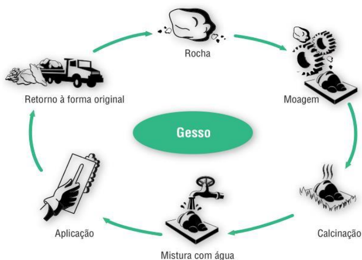
Figura 1 – Processamento do gesso.