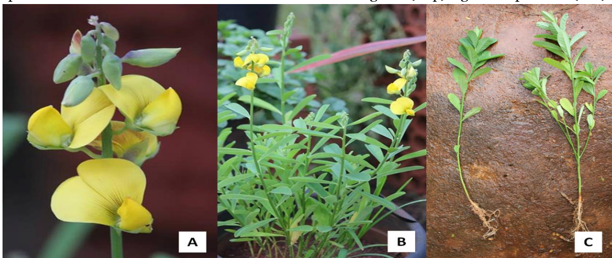
Figura 5 - (A) Flor de Crotalaria retusa ; (B) Planta adulta de C. retusa ; (C) Comparação das plantas de Crotalaria retusa entre os tratamentos sem gesso (esq.) e gesso superficial (dir.).

Além disso, a relação entre massa-seca de toda a planta e massa-seca apenas da raiz é de 80% ( r=0,8026; p=0,0005 ) no tratamento controle, porém essa relação chega até 87% ( r=0,8750, p=0,0002 ) para o tratamento de gesso profundo e 83% para gesso superficial ( r=0,8336; p=0,00006 ) (tabela 3 acima), evidenciando que há contribuição dos minerais do gesso para o crescimento radicular da planta, de forma que ao ser aplicado de forma profunda, resulta em maior relação planta-raiz (figura 5).