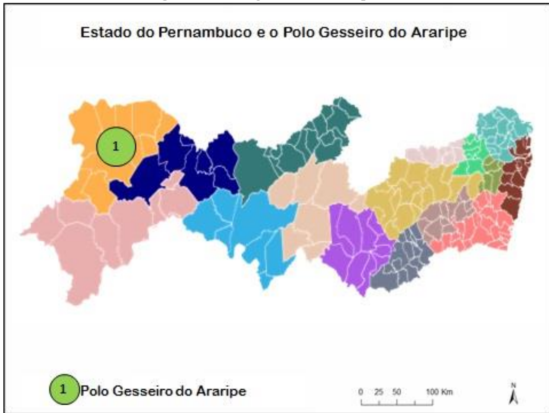
Figura 2 – Polo gesseiro do Araripe (PE).

Fonte: Adaptado da Revista Algomais, 2011. Organização: Vandervilson Alves Carneiro (2014)