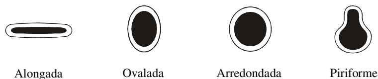
Figura 1. Desenho esquemático mostrando as diferentes formas das papilas valadas observadas no dorso da língua do eqüino.

As papilas valadas apareceram 152 vezes nas 57 línguas estudadas, apresentando média de 2,67 \pm 0,74 papilas por língua. As formas encontradas para estas papilas variaram entre ovaladas (35,5%), arredondadas (32,9%), alongadas (21,7%) e piriformes (9,9%) (Figura 1).