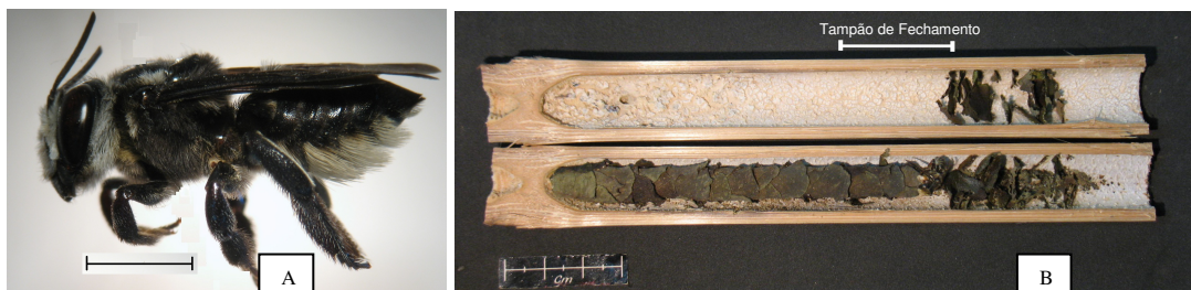
Figura 2. Megachile nigripennis . (A) Fêmea (escala de 1 cm) e (B) Ninho construído em ninho-armadilha de bambu, com folhas justapostas formando um tubo contínuo (escala de 3 cm).

As células apresentavam-se em uma série linear cilíndrica contínua no interior dos ninhos-armadilha, sendo os ninhos constituídos de pedaços finos de folhas cortadas e encaixadas. Foi observada de uma a seis séries de células no interior do ninho-armadilha e estas estavam soltas no interior da cavidade do ninho-armadilha. O tampão de fechamento dos ninhos, construído por fragmentos de folhas dispostos como lâminas de forma transversal (Figura 2B), estava presente na maioria deles. As dimensões internas dos ninhos nas diferentes altitudes estão apresentadas na Tabela 2.