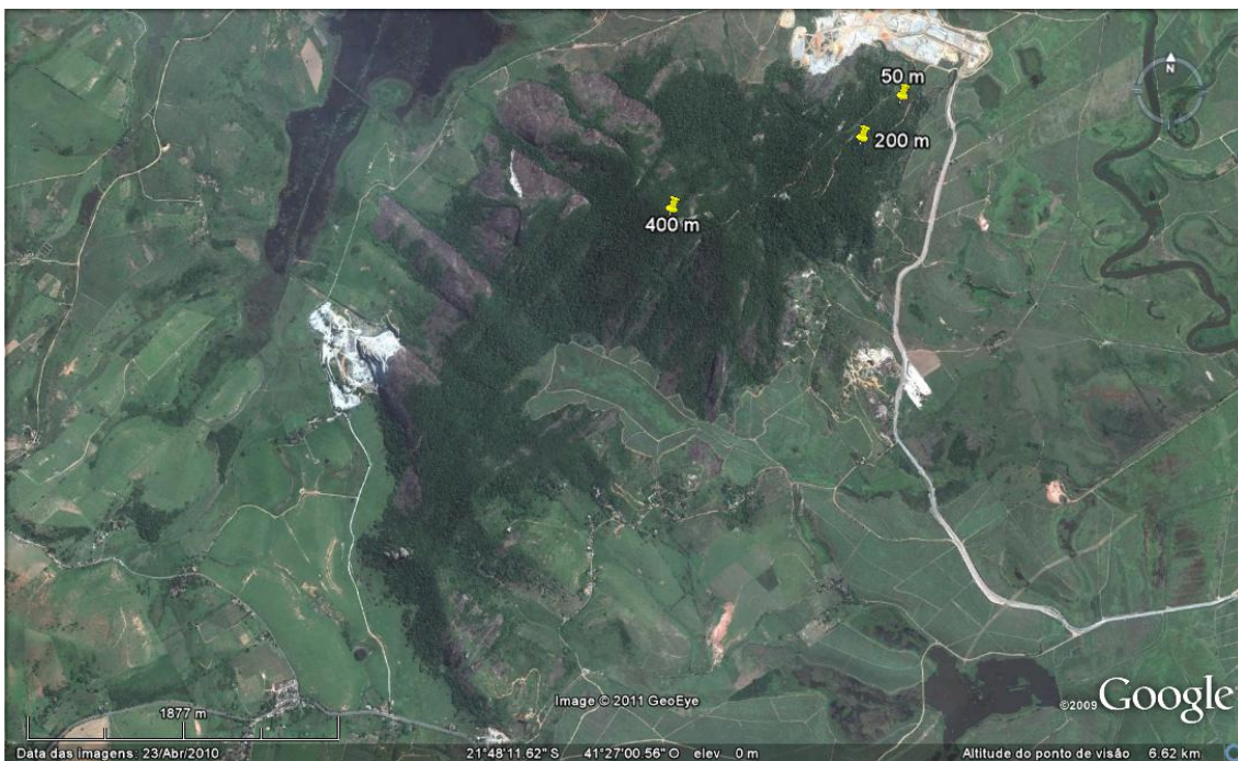
Figura 1. Sítios amostrais nas diferentes altitudes no Morro do Itaoca, Campos dos Goytacazes, RJ (Fonte: Google Earth, acesso em julho/2011).

Foram instalados 1.215 ninhos-armadilha em nove pontos de amostragem localizados em três altitudes: 50 m (pontos P1, P2, P3); 200 m (P4, P5, P6) e 400 m (P7, P8, P9) (Figura 1).