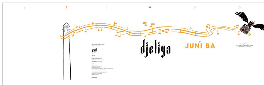
Figura 2. A coruja carregando um rádio cujas notas representam a fusão entre o ancestral e o moderno. 18

O elemento mais recorrente, como se pode observar, é a linha de notas musicais que percorre as páginas, sugerindo especificamente movimento e som. Esta linha, semelhante a um fio musical, desempenha um papel estruturante na organização rítmica da narrativa, ao mesmo tempo em que evidencia uma continuidade inerente à tradição oral de matriz africana. Esse fluxo está intrinsecamente ligado aos conceitos de oralidades e memórias, valorizados por Hampâté Bâ em suas reflexões. 19