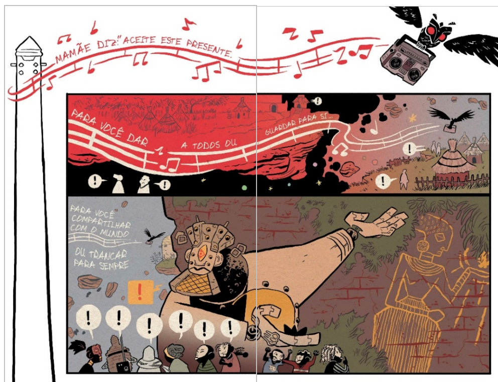
Figuras 9 e 10. Início da sequência final de Djeliya . 48