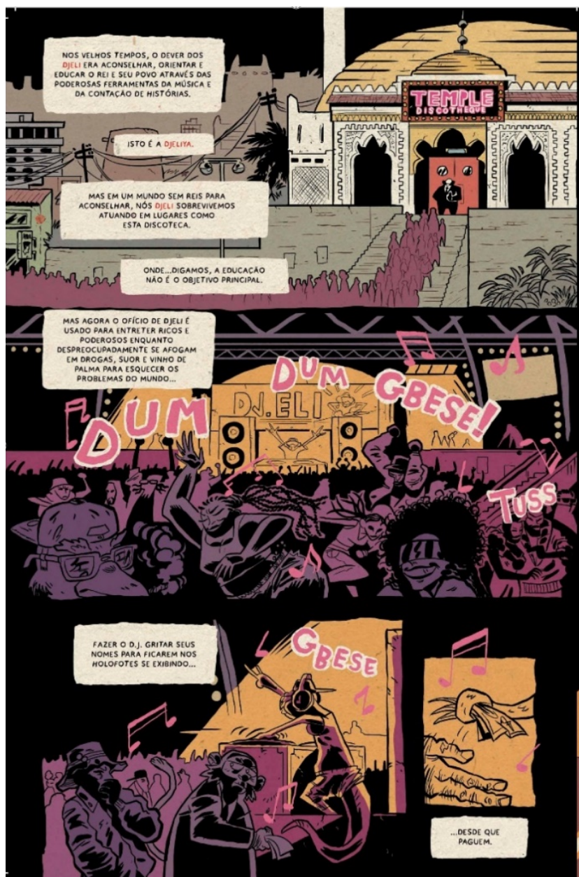
Figura 7. O cenário de um clube noturno. 45

ca Temple (Figura 7) ilustra de forma pessimista o declínio e a banalização da função social dos djeliw . A música, que outrora narrava e preservava a memória coletiva, agora ressoa num caos de luzes e sons distorcidos, expressando uma desconexão com as raízes culturais africanas.