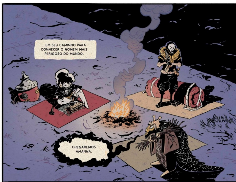
Figura 1. Awa, Mansour e Oriundo, um trio peculiar. 7

A trama desenvolve-se em torno de um trio peculiar (Figura 1), cujo objetivo é encontrar Soumaoro, “o homem mais perigoso do mundo”.