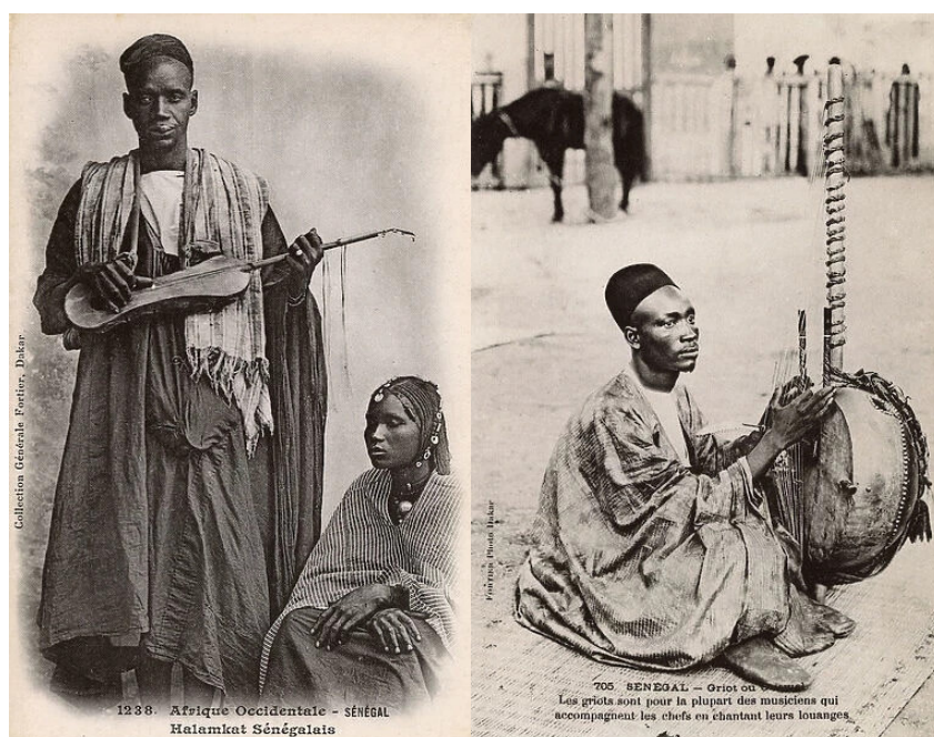
Figuras 4 e 5. À esquerda, djeli senegalês tocando xalam. 42 À esquerda, djeli com a kora. 43

Os djeliw (Figuras 4 e 5) e outros narradores orais confirmam e transmitem o patrimônio cultural, ensinamentos, valores e memória coletiva da comunidade. Através de sua voz , o djeli recita o passado e o atualiza, adaptando-o às circunstâncias presentes, como sugeriu o crítico nigeriano Isidore Okpewho em análises sobre performances orais em contextos africanos. 41 Segundo Isidore Okpewho, narradores orais em sociedades africanas possuem um papel ativo na construção do significado, moldando a narrativa conforme o contexto de sua enunciação. Suas histórias, assim, deixam de ser simples recontos de eventos e se afirmam como atos de criação cultural.