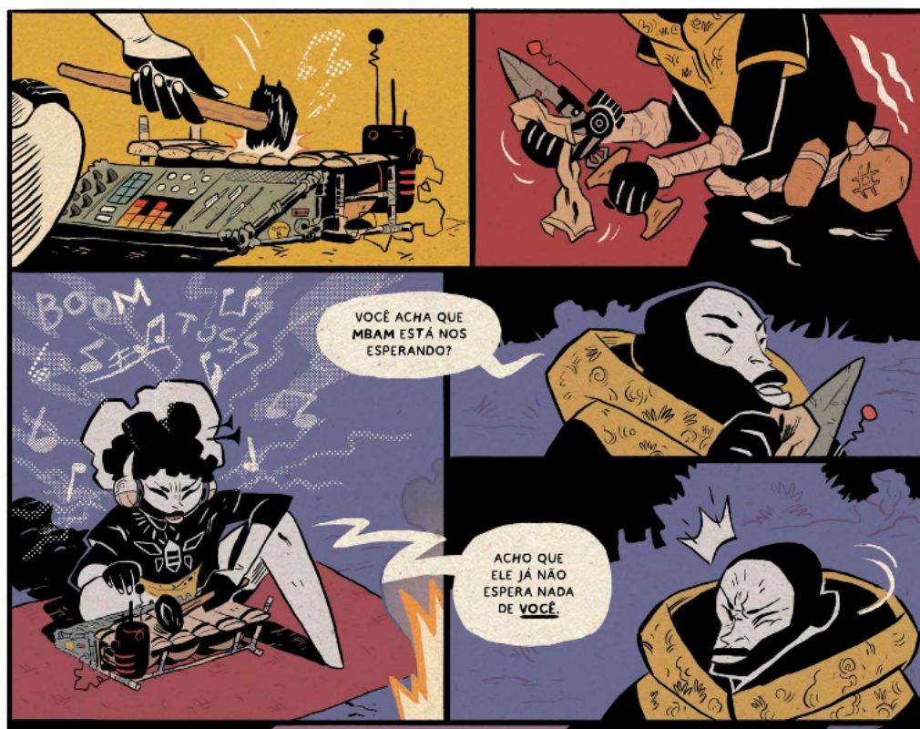
Figura 8. A interação entre Awa – aqui vista com seu balafom ancestral e tecnológico – e Mansour. 47