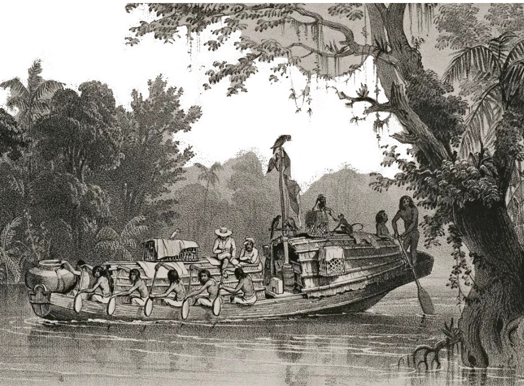
Expedição pelo Rio Amazonas, século XIX. Veja , 22 out. 2021, fotografia, montagem (detalhe).