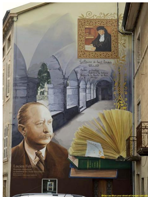
Figura 1. Mural Lucien Febvre em Saint-Amour/França. 2

Este artigo tem como foco as obras Martin Luther: un destin ; Le problème de l'incroyance au XVI e siècle: la religion de Rabelais ; Autour de l'Heptaméron: amour sacré, amour profane , do historiador Lucien Febvre e os paradoxos em torno da recusa do gênero biográfico em sua produção. 3 Os trabalhos têm em comum o interesse por sujeitos históricos, suas ideias, emoções e contextos. No entanto, em todas elas, Febvre nega estar escrevendo uma biografia.