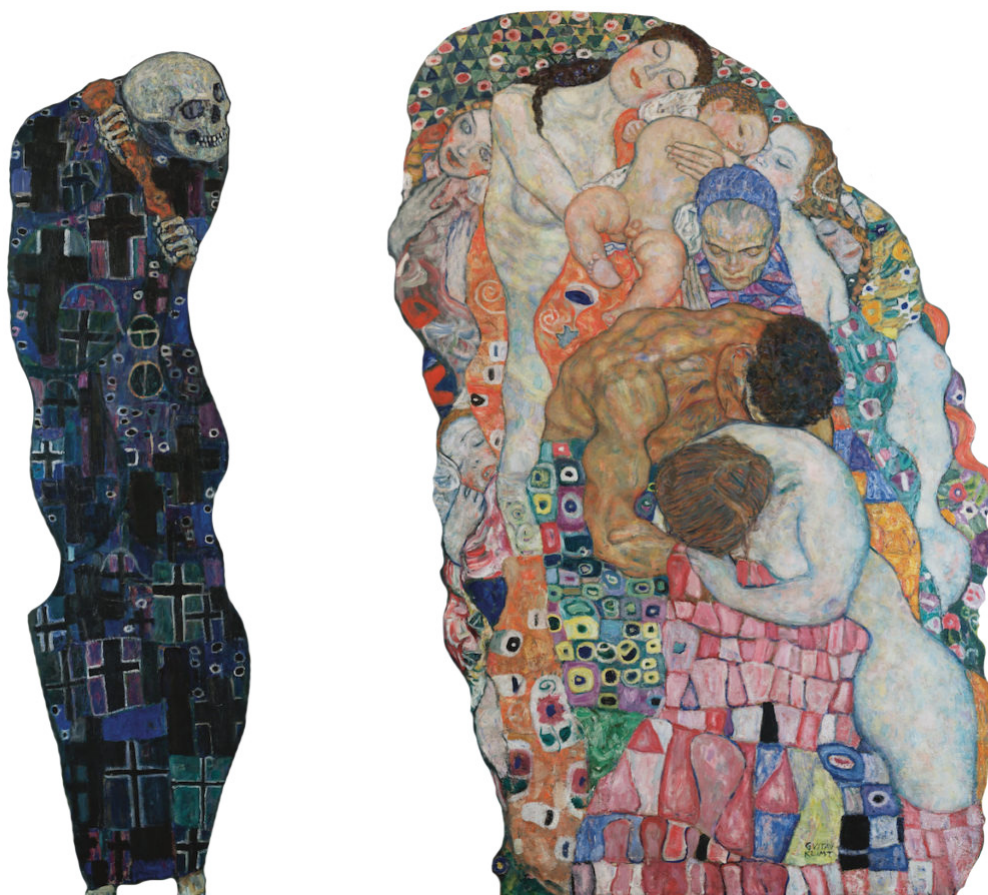
Morte e vida , de Gustav Klimt, 1910-1915, óleo sobre tela, fotografia, montagem (detalhe).