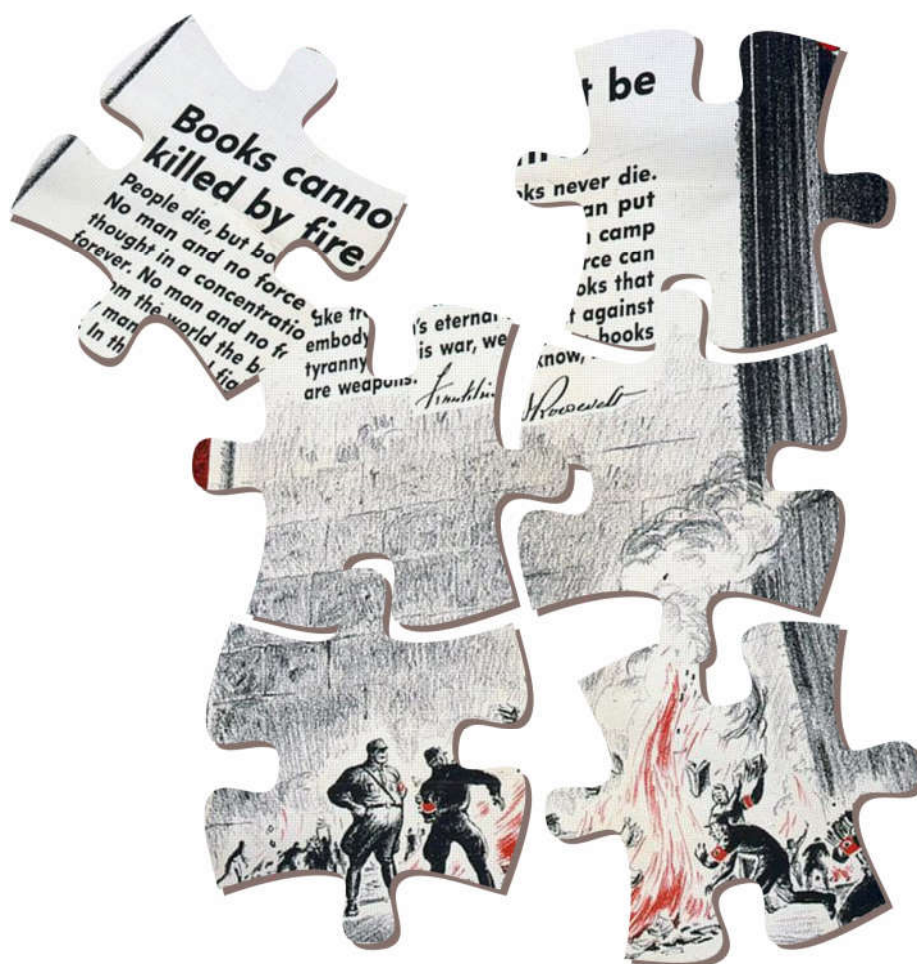
Campanha do Office of War Information. Série World War II Posters, 1942-1945, fotografia (detalhe).