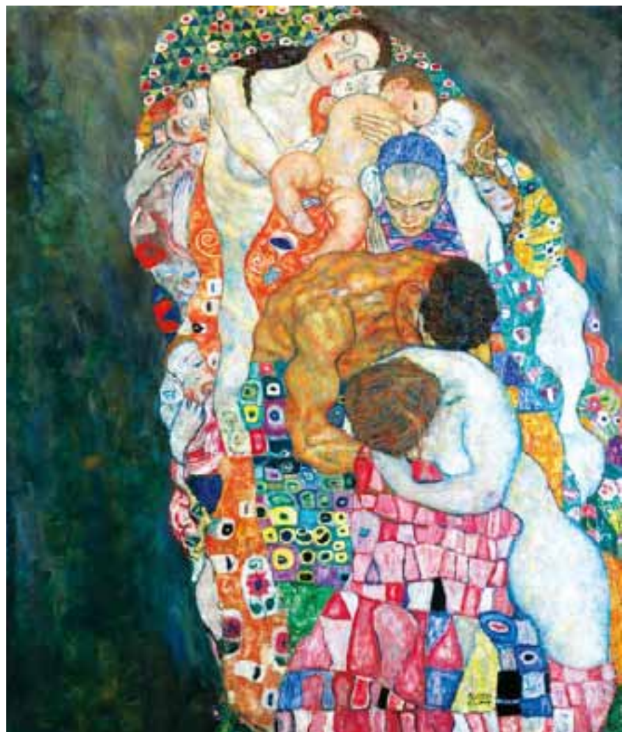
Gustav Klimt. A vida e a morte , 1916 (detalhe).