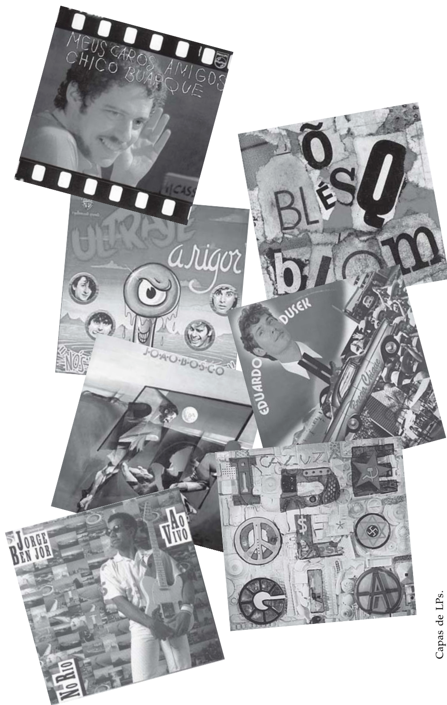
Capas de LPs.