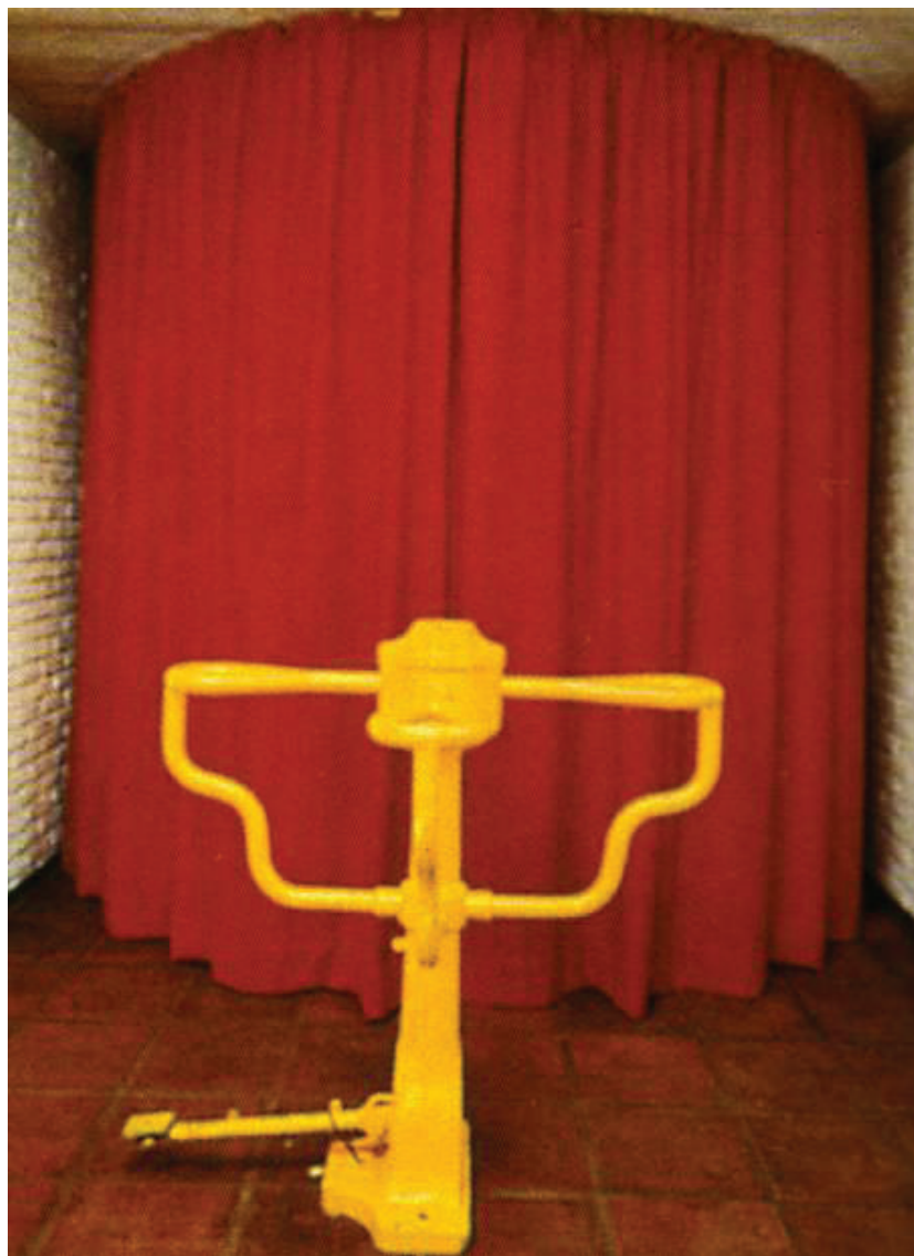
Adoração ou Altar para Roberto Carlos , Nelson Leirner, 1966, instalação (detalhe externo)

Da mesma forma que o “porco”, a crítica ao estatuto do artístico parece ter se tornado a vocação de outras obras de Leirner. Quando fora exposta na mostra “Nova Objetividade Brasileira”, em 1967, no Rio de Janeiro, Adoração também se propunha crítica às instituições da arte, que executavam, a seu modo, segundo Leirner, maneiras de excluir o público da dimensão estética da arte. A catraca vinha não apenas denunciar uma iconização de Roberto ou, talvez, a própria lógica mercadológica do mercado religioso de bens simbólicos, como também salientava o sentido de bem-capital que a arte havia adquirido após a constituição do the dealer-critic system . 30