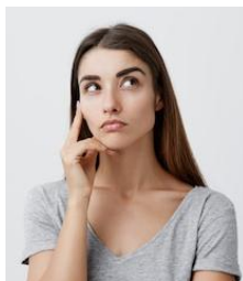
Figura 2 - Processo de reação não-transacional