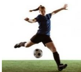
Figura 1 - Processo de ação transacional

mentais ou verbais. O que define se um processo de ação ou reação é transacional é a presença de dois ou mais participantes. Nos processos de ação os participantes são chamados de ator e meta, sendo ator aquele que realiza a ação e meta o que recebe a ação (Nascimento; Bezerra; Heberle, 2011; Kress; van Leeuwen, 2006). As figuras abaixo ilustram os tipos de processo presentes nas representações narrativas: