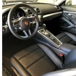
Figura 6 - Processo analítico