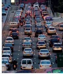
Figura 5 - Processo classificatório