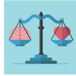
Figura 7 - Processo simbólico