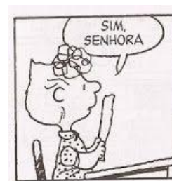
Figura 4 - Processo verbal