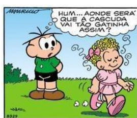
Figura 3 - Processo mental