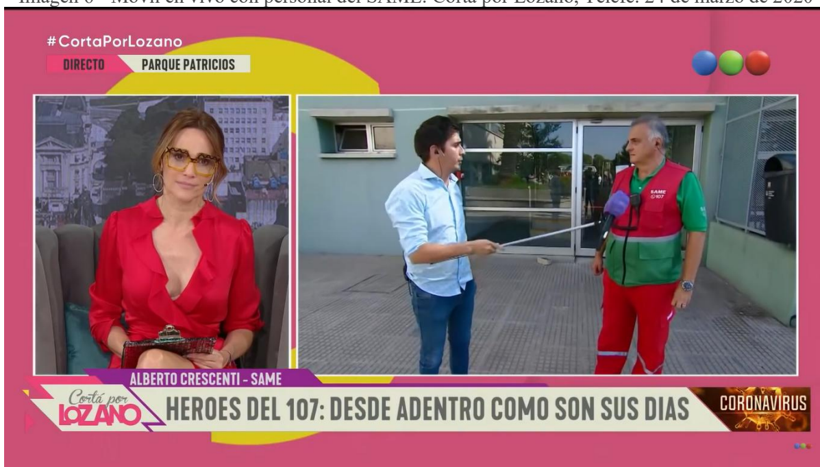
Imagen 6 - Móvil en vivo con personal del SAME. Cortá por Lozano, Telefé. 24 de marzo de 2020

Del mismo modo que las lógicas mediáticas penetran la construcción de un hecho mediático como lo fue el anuncio del ASPO en cadena nacional, comprobamos que se trata de