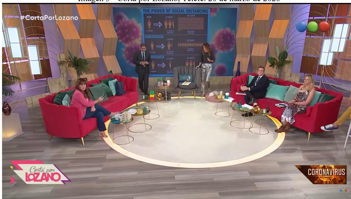
Imagen 3 - Cortá por Lozano, Telefé. 20 de marzo de 2020

De fondo, una pantalla proyecta la imagen en video de los entrevistados, los móviles en vivo y sirve de soporte audiovisual para que el especialista en salud exponga una sección diaria dedicada al avance de casos de COVID-19 en el país y en el mundo. A pesar de la distancia social, los panelistas y la conductora interactúan entre sí y vía videollamada con los invitados desde un sillón. Los graphs o zócalos funcionan dando anclaje visual respecto al tema que se está tratando.