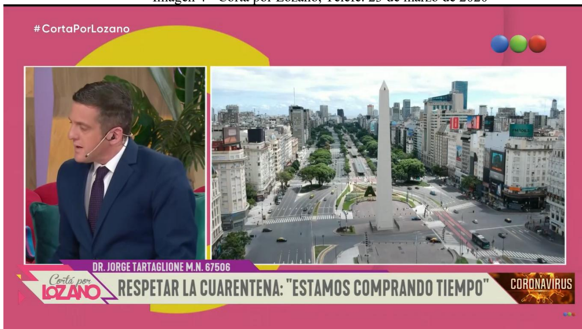
Imagen 4 - Cortá por Lozano, Telefé. 23 de marzo de 2020

Esta breve descripción de los rasgos formales del programa nos ofrece un panorama de las huellas estilístico-genéricas del panelismo y cómo estas evolucionan durante la primera semana de ASPO. Como mencionamos, estas huellas imprimen su textura entendida como efectos de sentido sobre las temáticas a tratar (Fernández, 2022). Ante la necesidad de