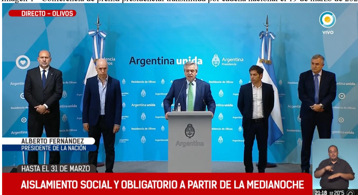
Imagen 1 - Conferencia de prensa presidencial transmitida por cadena nacional el 19 de marzo de 2020

En lo que respecta a los juegos de cámara, es interesante como los encuadres – que varían a lo largo de la transmisión – provocan diferentes efectos de sentido en relación a mensaje transmitido: cuando el presidente refiere al resto de las provincias, gobernadores o la nación en general, la cámara se abre mostrando a los 5 mandatarios de pie en el escenario. En cambio, al detallar el alcance de las normativas sanitarias, la cámara se cierra a un plano medio que toma únicamente al presidente y su atril -sobre el que descansa un envase de alcohol en gel-. Estas decisiones, así como la puesta en escena, no son fortuitas sino diseñadas para la transmisión de este evento político-mediático.