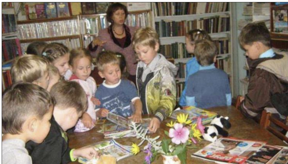
Figura 6: Aula zankoviana