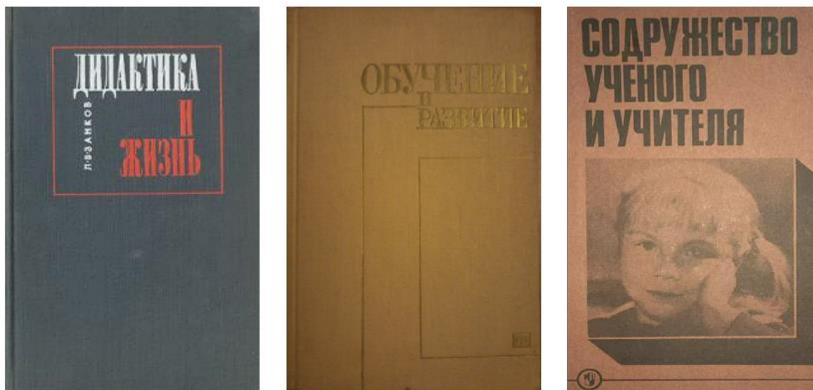
Figura 4: Capas dos livros, da esquerda para direita: “Didática e vida” (1968); “Aprendizagem e desenvolvimento (1975a); e “Conversas com professores” (1975b).