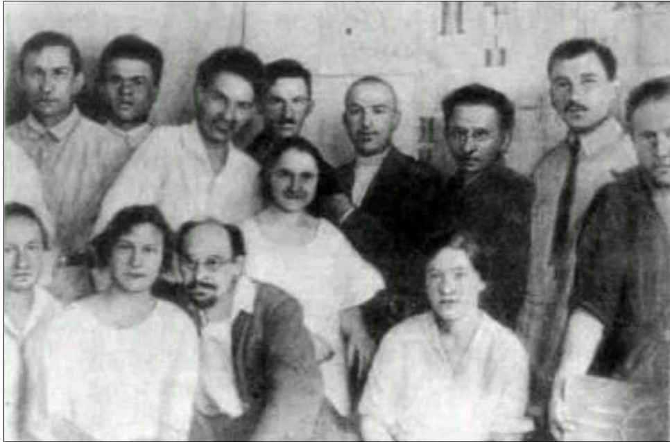
Figura 2: Entre os homens de pé, da esquerda para a direita: o primeiro é I.M. Soloviev; o terceiro, A.R. Luria; o quinto, L.S. Vigotski; e o sétimo, L.V. Zankov.