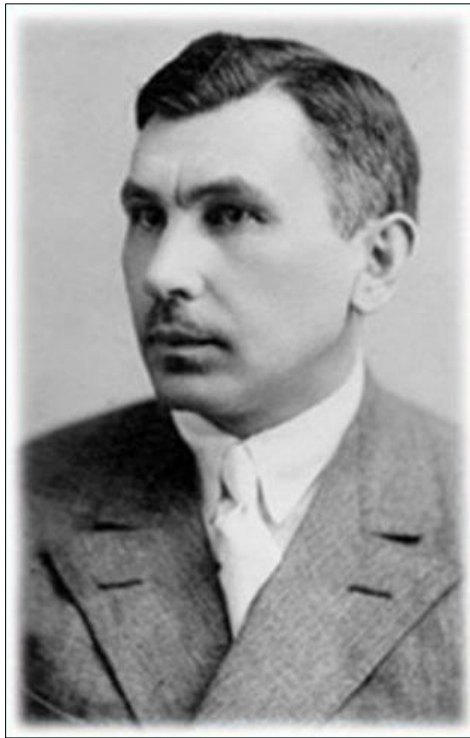
Figura 1: Leonid Vladimirovich Zankov (Леонид Владимирович Занков)