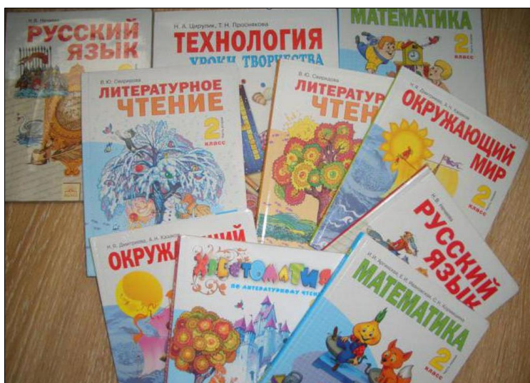
Figura 7: Livros didáticos do sistema Zankov.