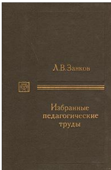
Figura 5: Capa do livro “Trabalhos pedagógicos selecionados” (1990).