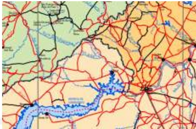
Fig. 01 – Fragmento do mapa da região nordeste.

Ao lermos a legenda da figura 01 já sabemos de qual mapa pertence o fragmento, bem como sabemos a autoria do mesmo. Todavia, não se pode conhecer as informações. Assim, é importante ensinar para alunas e alunos que as diferentes cores se referem a diferentes áreas, visto que o espaço representado por essas cores parece bem amplo, mas ainda não se pode afirmar o tamanho, pois não temos nenhuma certeza quanto a escala e localização. Nem mesmo podemos afirmar sobre as linhas pretas, vermelhas e azuis. Esse momento é importante fundamentar para alunas e alunos os conceitos que promovem um mapa e definir sua importância. A partir de Santos (1987) conseguimos olhar para a figura 01 e exercitar o conhecimento prévio ou espontâneo (VYGOSTSKY, 1990) pela promoção de nossa constituição do modo de vida, da cultura e como olhamos objetivamente o mundo. É fundamental o exercício da criatividade para as respostas a partir das questões formuladas pelas/pelos docentes. Tais questões partirão sempre da realidade social, econômica e cultural espacializada.