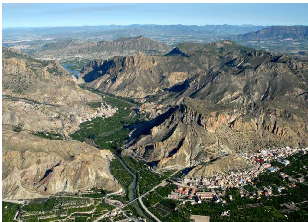
Figura 2. Vista área parcial del Valle de Ricote.