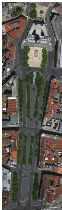
Fig. 5 - Avenida dos Aliados e Praça da Liberdade - projecto de remodelação

Outra das intervenções no espaço público tem sido a criação de ciclovias, actualmente o Porto conta com 11,90 Km de ciclovias, a da Foz que percorre toda a marginal marítima e a marginal do rio, desde o edifício transparente, situado junto ao Parque Ocidental da Cidade