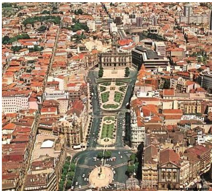
Fig.4 - Avenida dos Aliados e Praça da Liberdade anos 90