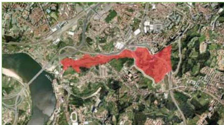
Fig. 2 – Localização do futuro Parque Oriental