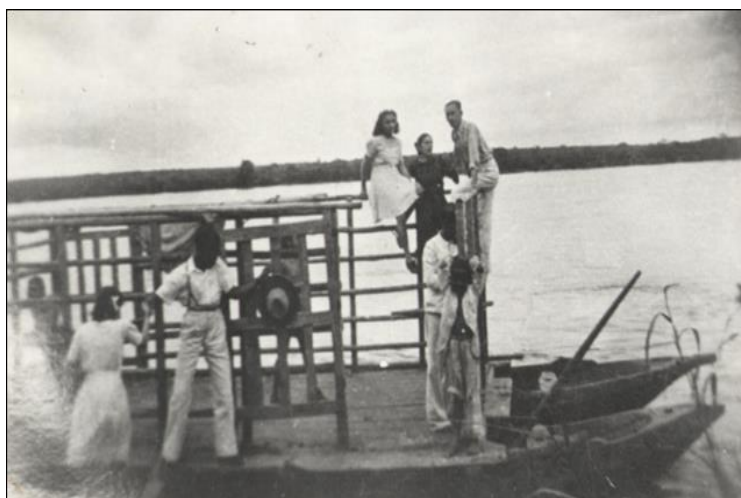
Imagem 1: Ajoujo