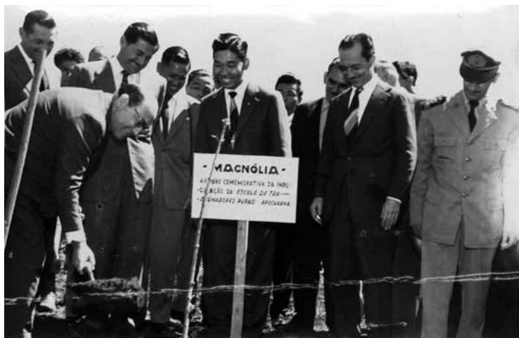
Imagem 2 - Inauguração da Escola de Trabalhadores Rurais de Apucarana-PR