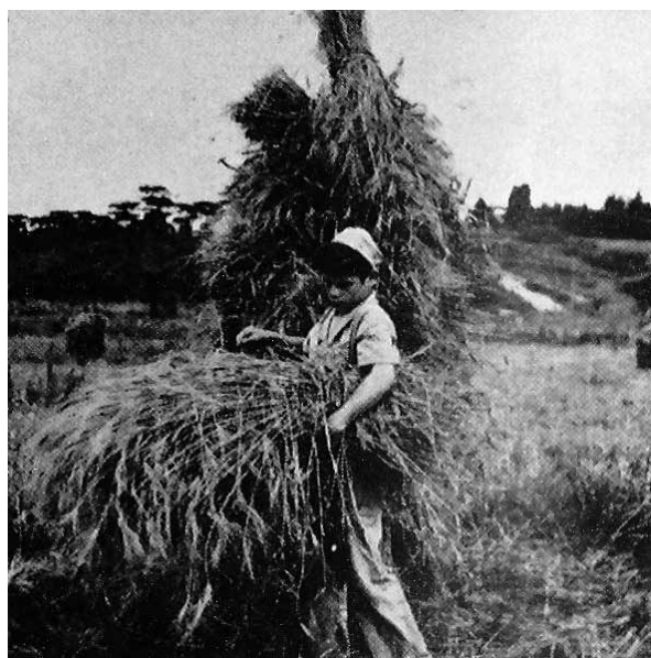
Imagem 3 – Escola de Trabalhadores Rurais Lysímaco Ferreira da Costa, Rio Negro-PR

A imagem a seguir retrata aluno da ETR Lysímaco Ferreira da Costa, situada no município de Rio Negro, em atividade prática no campo.